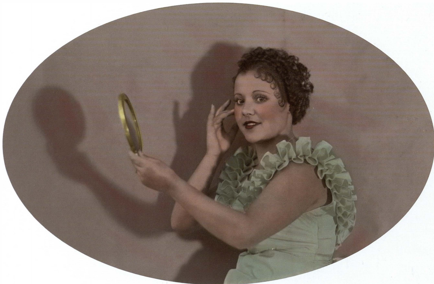
Retrat d'estudi il·luminat manualment i posat en un marc de cartró de la casa Jou. L'aportació de color en un període que la fotografia era en blanc i negra s'aconseguia amb anilina, llapis grassos o olis. 1930-1944