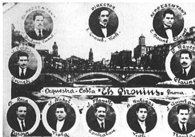
Coplà Els Gironins. Girona, 1919.

Expresado en un único gentilicio, se puede decir que la sardana moderna es claramente gerundense. Fue en el Alto y Bajo Ampurdán, en el Gironés y en La Selva donde, desde el siglo pasado, tuvo lugar la mayor expansión de la sardana, tanto en compositores como en instrumentistas.