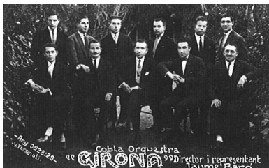
Coplà-orquestra Girona. Girona, 1928-1929.