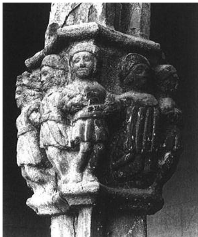
Capitel gòtic. Siglo XIV. Personajes cogidos de la mano. Casa Estorc, Girona

Los orígenes lejanos de la sardana son equívocos y están bastante desdibujados. No ha sido hasta hace unos ciento cincuenta años que la sardana moderna, llamada llarga , se ha conformado como lo que es hoy, tanto en la música como en la coreografía, convirtiéndose en la danza más genuina y representativa de Cataluña.