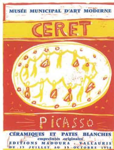
Picasso. Cartel de la exposición de cerámicas y platos de 1958 en el Museo Municipal de Arte Moderno de Ceret.

servatorio de música Isaac Albéniz de Girona ha sido el primero de Cataluña en ser reconocido como centro docente oficial para la enseñanza musical de los instrumentos específicos de la copla: tenora, tible, flabiol y tamborí .