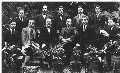
Coplà l'Art Gironí. Girona, 1920. AIAG