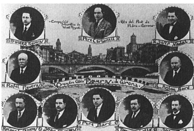
Coplà Figueres. Girona, 1926-1928.