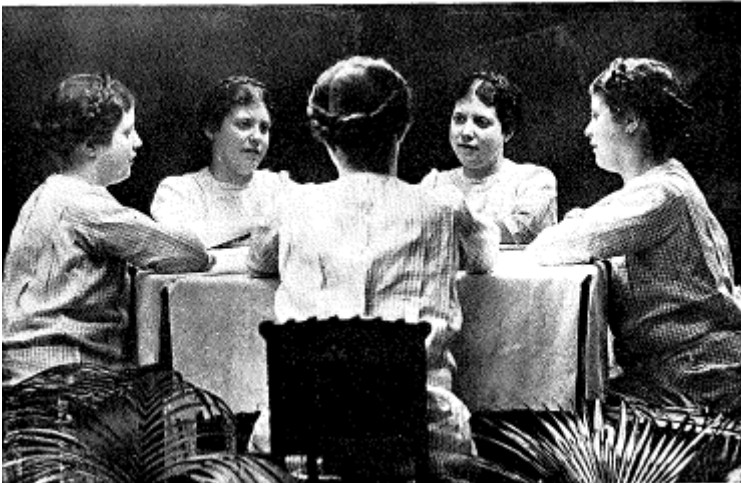
Fig. 7. La seva filla. Fotomuntatge per exposició múltiple. [s.d.]. Localització desconeguda.

Les composicions múltiples són altres exemples d'experimentació visual, un recurs que també treballarà en la filmografia. A tall d'exemple es poden assenyalar la imatge repetida d'una de les seves filles entorn a una taula (Fig. 7) i la composició amb un fill com a àngel en context celest, mitjançant un retrat doble (Fig. 8). En aquest cas, el ressò de l'estètica victoriana i específicament de la producció de Julia Margaret Cameron torna a ser molt present.