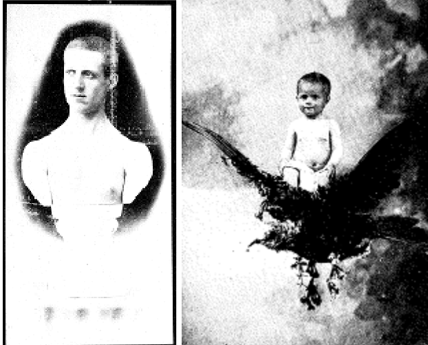
Fig. 5. Autoretrat com a bust escultòric. c. 1887. Fotomuntatge. Col. Josep Truyol i Thomàs. Fig. 6. Retrat de Bab sobre un ocell. Fotomuntatge. [s.d.]Localització desconeguda.

D'altra banda, els fotomuntatges tenien també la voluntat de recrear una visió màgica i irreal, i denoten a més la motivació d'experimentació visual. N'és exemple un autoretrat com a bust escultòric (fig. 5). Altres obres semblen inspirades en composicions orientals i són al·legories de l'arribada del nou any (1900). En aquests casos els models tornen a ser els seus fills sobre diferents tipus d'aus (Fig. 6).