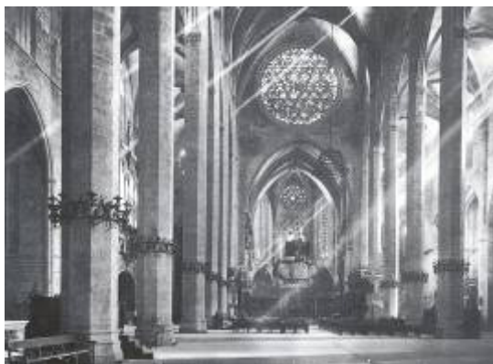
Fig. 9. Interior de la seu. Postal.