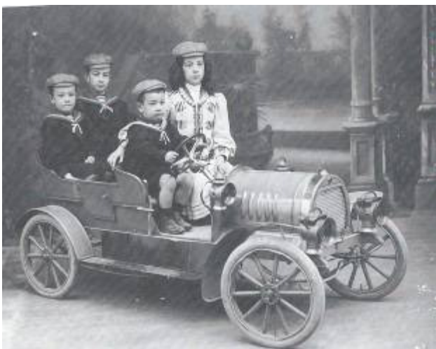
Fig. 4. Passeig en cotxe. Composició fotogràfica per encàrrec. [s.d.].