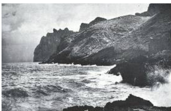
Fig. 10. Cala Sant Vicent. Postal