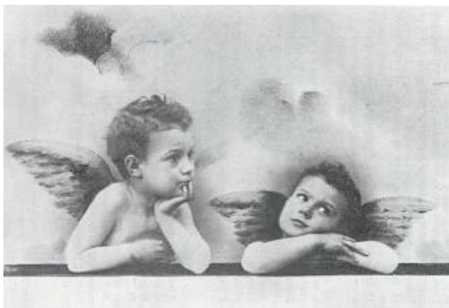
Fig. 8. Retrat d'un fill com a àngel. Fotomuntatge [s.d.], Localització desconeguda.