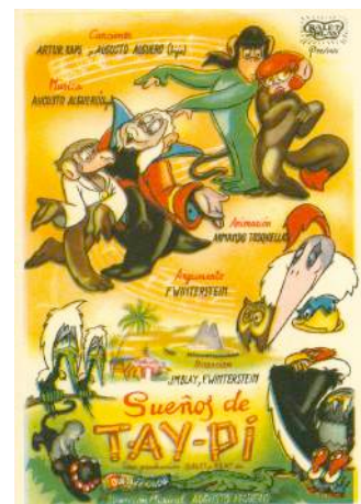
Programa de mano de Sueños de Tay-Pi (1952).