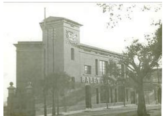
Fotografía de la sede de la productora i distribuidora Balet y Blay, en el barrio de Vallcarca en Barcelona.