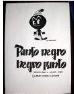
Diseño del proyecto de animación de un largometraje inédito: Punto negro (1983). Col·lecció Isabel Moreno

No pudo conseguir cumplir su deseo de seguir trabajando en el mundo del cine de animación, aunque hará una colaboración dibujando los fondos del largometraje El mago de los sueños (1966). Durante muchos años, intentó sacar adelante La mancha de tinta (1987), un proyecto de animación que tenía muy avanzado, pero que nunca consiguió materializarse. Arturo Moreno muere en 1993.