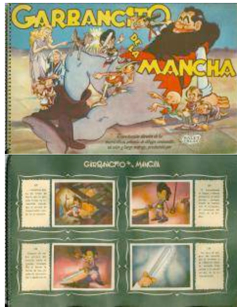
Album de cromos de la película Garbancito de la Mancha . Editorial Ruiz Romero (1946). Museu del Cinema-Col·lecció Antoni Furnó

La película tuvo un gran éxito de crítica y público y obtuvo unas ganancias económicas de entre dos y tres millones de pesetas