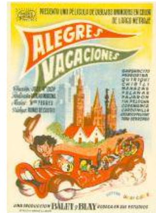
Programa de mano de Alegres Vacaciones (1948).

El hecho de que a media producción del filme se quemara el estudio donde se estaba realizando y que se destruyera gran parte del material, complicó mucho el rodaje. Se tuvieron que rehacer muchos dibujos con el cansancio lógico de los dibujantes por el trabajo repetitivo y monótono. La película se estrenó el 27 de diciembre de 1948.