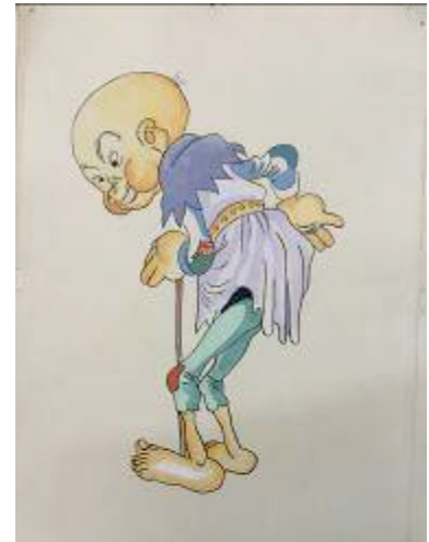
Dibujos originales a tinta de algunos de los principales personajes de Garbancito de la Mancha : Gigante Caramanca, Garbancito y Pelanas. Museu del Cinema-Col·lecció Antoni Furnó