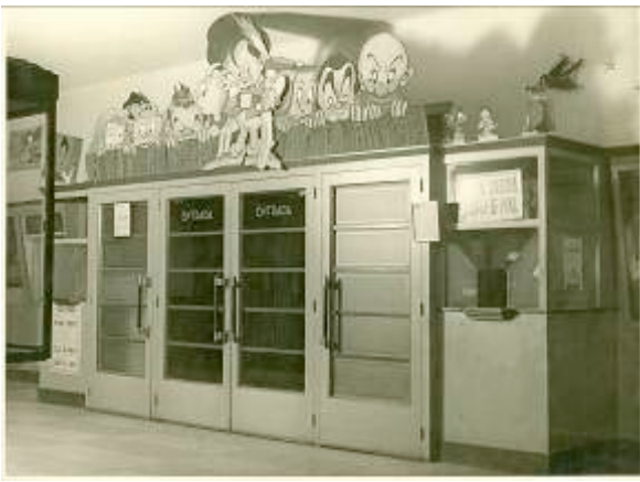
Entrada al cine Fémina de Barcelona decorado con motivo del estreno de la película Garbancito de la Mancha el 23 de noviembre de 1945.