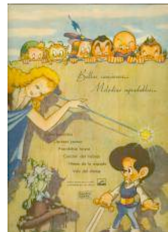
Material de promoció para la prensa y exhibidores de la película Garbancito de la Mancha . Museu del Cinema-Col·lecció Antoni Furnó.