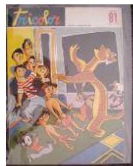
Tricolor, nº 81 (Ministerio de Educación, Caracas, Venezuela, marzo de 1956) y nº 200 (Ministerio de Educación, Caracas, Venezuela, febrer de 1969).