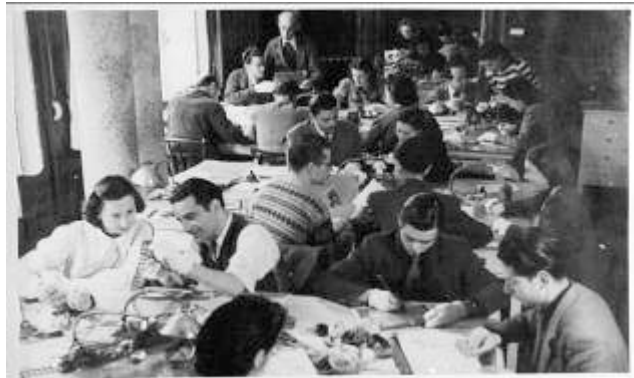
Los nuevos estudios Dibujos Animados Chamartín, fusión de las productoras Dibsono Films y Hispano Gráfico Films, se instalaron en la Casa Batlló de Barcelona en 1941