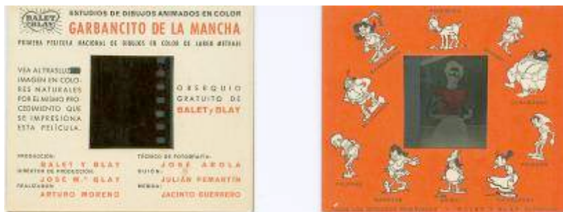
Cartones con un fotograma para la publicidad del Garbancito de la Mancha .