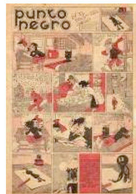
Página de la serie de Arturo Moreno "Punto Negro". Pocholo (1934).

L'Esquella de la Torratxa . En Papitu , revista sicalíptica (erótica), colaboraba con el seudónimo de Moro.