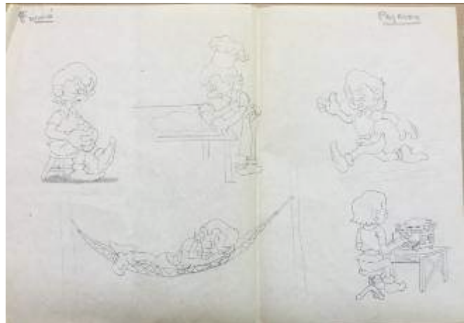
Esbozo original a lápiz de uno de los personajes principales de la película: Pajarón. Atribuido a Trino Furnó Brujó. Museu del Cinema. Col·lecció Antoni Furnó.

Por ejemplo, en España no había ningún fabricante a quien poder comprar las tres toneladas de planchas de acetato necesarias para hacer los dibujos de la película. Se tuvieron que adquirir en Suiza y trasladarlas a Barcelona en tren, que estuvo perdido durante un mes debido al bombardeo de una estación francesa por donde tenía que pasar. Tampoco había en el España ningún laboratorio donde poder revelar la película en color, por lo que los negativos tenían que enviarse a Londres, que era bombardeada entonces por la aviación alemana.