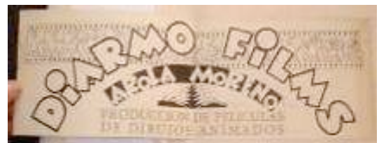
Original del logotipo de la productora Diarmo Films (1942)