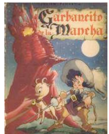
Cuento Garbancito de la Mancha de Julian Pemartín, editado por Editorial Saturnino Calleja (1945).

El libro escogido tenía unas ventajas claras en una época de represión de todas las libertades. El escritor y poeta Julián Pemartín era un falangista de primera hora y en esos momentos ejercía de director del Instituto Nacional del Libro Español. Sus cargos políticos dentro del régimen franquista aseguraban la no intromisión de los censores en la realización de la película. La moralidad, las invocaciones religiosas, la exaltación de los valores tradicionales aportados por Pemartín en el libro constan en el sustrato del filme, pero Moreno y sus guionistas aportaron una gran cantidad de gags visuales que consiguieron aliviar y enmascarar el mensaje reaccionario inicial del cuento Garbancito de la Mancha .