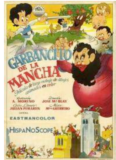
Cartel original de "Garbancito de la Mancha" (1945).