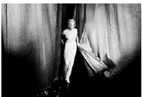
43x58,1cm Marlene Dietrich en su último concierto en el Wimbledon Theatre. Londres 1975