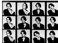
46,5x58cm Isabella Rosellini. Londres, 1984