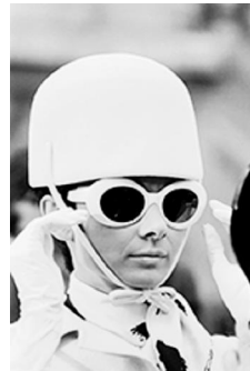
81x58,2cm Audrey Hepburn Paris, 1966