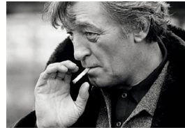
55x73,1cm Robert Mitchum. Holanda, 1986