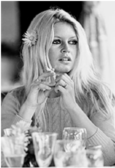
81x58cm Brigitte Bardot. Deauville, 1968