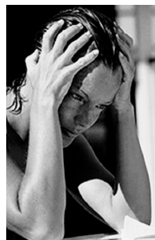
81,1x58,1cm Romy Schneider. St Tropez, 1982