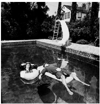
58x58cm Peter Cook y Dudley Moore. Beverly Hills, 1975