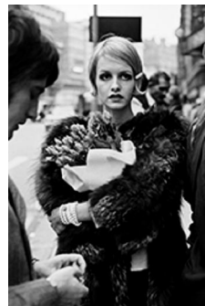
81,1x58,2cm Twiggy "el rostro del 66". Londres, 1966