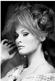
78x57cm Ursula Andress en rodaje de She (She. La diosa del fuego) . Londres, 1965