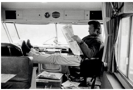
55x73cm Clint Eastwood en un descanso del rodaje de Joe Kid . Arizona, 1972