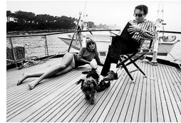
54,9x73cm Britt Eckland y su marido Peter Sellers. Sur de Francia, 1966