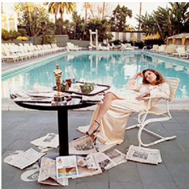
73x73,1cm Faye Dunaway el día siguiente a recibir el Oscar. Beverly Hills, 1977