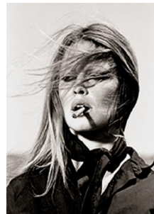
71,1x58,1cm Brigitte Bardot en el rodaje de The Ballad of Frenchie King . ( La leyenda de Frenchie King ). Almeria, 1971