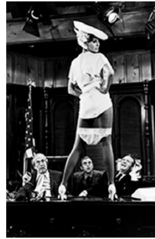
81,1x58cm Raquel Welch en el rodaje de Myra Breckinridge . Los Angeles, 1970