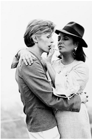
91,1x73cm David Bowie y Elizabeth Taylor. Los Angeles, 1975