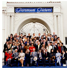
73,1x73,1cm 75è aniversario de la Paramount Pictures. Los Angeles, 1988