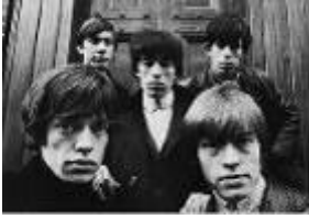
54,9x73cm The Rolling Stones en Hanover Square. Londres, 1964