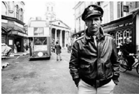
43,1x58,1cm Harrison Ford en el rodaje de Hanover Street . Londres, 1979