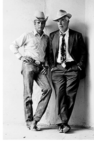
99x73cm Paul Newman y Lee Marvin en el rodaje de Pocket Money ( Los indeseables ). Denver, 1971