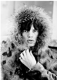
81,1x58cm Mick Jagger. Londres, 1964