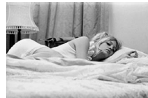
43x58,1cm Goldie Hawn en el rodaje d' A girl in the soup ( Hay una chica en mi sopa ). Londres, 1970