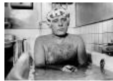
43,2x58cm Richard Burton en el rodaje de Staircase ( La escalera ). París, 1970