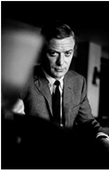
81x58cm Michael Caine en el rodaje de Deadfall (Angustia Mortal) . Espanya, 1968