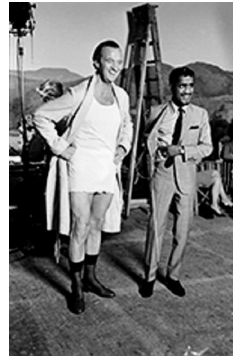
78x57cm Sammy Davis Junior y David Niven en el rodaje de Casino Royale . Londres, 1967