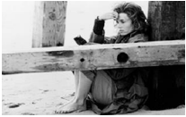
43,1x58,1cm Jane Fonda en un descanso del rodaje de Julia . Norkflok, 1977