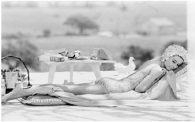
55x73cm Audrey Hepburn en el rodaje de Two for the Road ( Dos en la carretera ). St. Tropez, 1967