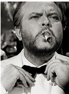
72x57cm Orson Welles en el rodaje de Casino Royale . Londres, 1967