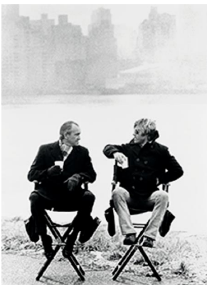
99x73cm Robert Redford y Richard Helms en un descanso del rodaje de Three days of the Condor ( Los tres días del Cóndor ). Nueva York, 1975