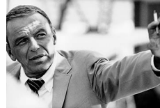
55x73,1cm Frank Sinatra. Miami, 1968