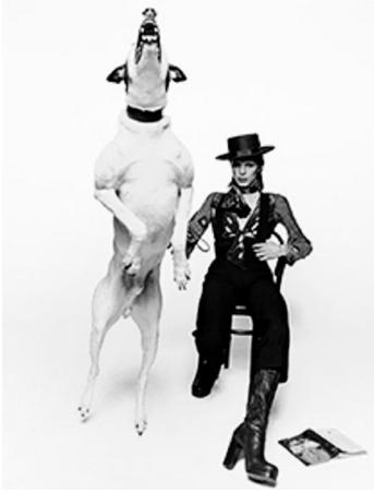
91x73cm David Bowie posando para su disco Diamonds Dogs . Londres, 1974