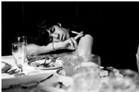
43,1x58cm Keith Richards. Londres, 1963