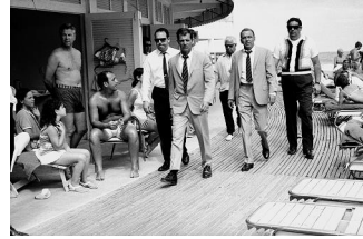
58x78cm Frank Sinatra con sus guardaespaldas Miami, 1968