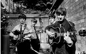
54,9x73cm The Beatles en los estudios Abbey Road. Londres, 1963