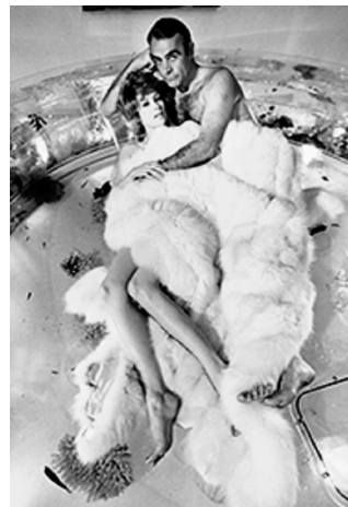
99x73,1cm Sean Connery y Jill St John en el rodaje de Diamonds Are Forever ( Diamantes para la eternidad ). Las Vegas, 1971