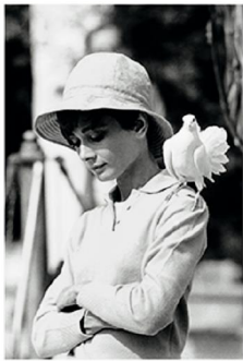
81,1x58cm Audrey Hepburn en el rodaje de Two for the Road ( Dos en la carretera ). St Tropez, 1967