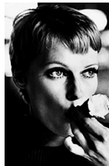
77,9x57cm Mia Farrow en el rodaje de Full Circle ( Círculo de la muerte ). Londres, 1977