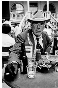
81,1x58,1cm Lee Marvin. Denver, 1971