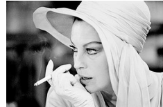
55x73,1cm Ava Gardner en el rodaje de The life and times of Judge Roy Bean (El juez de la horca) . Arizona, 1973