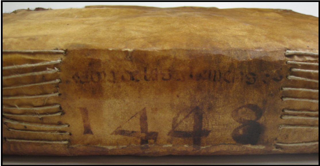
AMGi, Col·lecció Ajuntament de Girona, Llibre del Sindicat Remença de 1448 (llom).