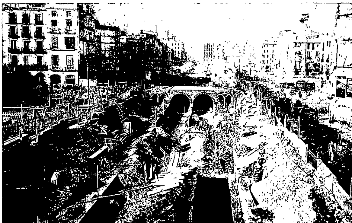
Fotoperiodisme. Frederic Ballell. Reforma de Barcelona. Aspecte del primer tros de la Via A des de la banda de mar. Publicada a Il·lustració Catalana núm. 448, de 7 de gener de 1912. AHCB-AF S0/436.