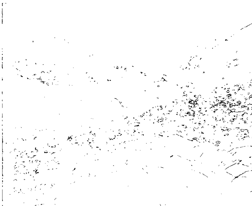
Fotografia excursionista. C.A. Torras. Corna de Bessiberri, Ull de Ter. Publicada a Il·lustració Catalana núm. 255, 19 d'abril de 1908, formant part d'un reportatge de l'excursió. AHCB-AF S0/5113.