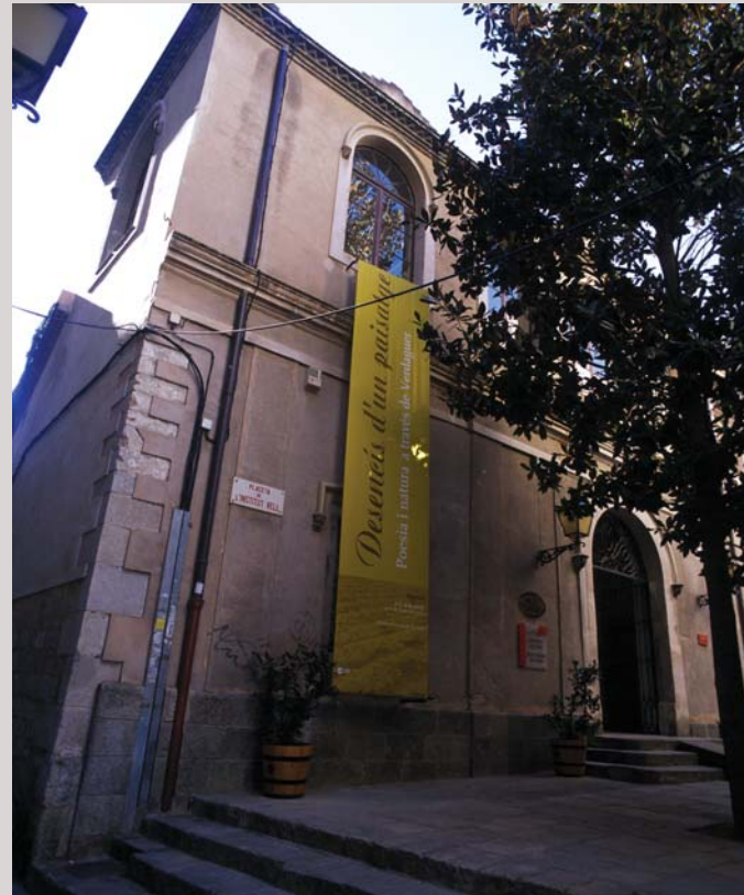
Imatge façana Placeta de l'Institut Vell Imagen fachada Placeta de l'Institut Vell Image of the «Placeta de l'Institut Vell» façade