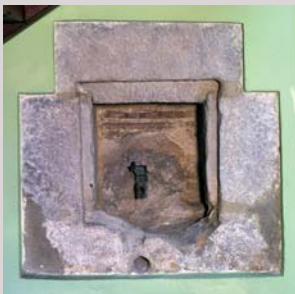
Aixeta de l'antic convent (segle XVIII) Grifo del antiguo convento (siglo XVIII) Tap of the old friar monastery (18th century)