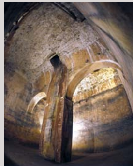
Cisterna del convent (anterior a 1762) Cisterna del convento (anterior a 1762) Friar monastery's cistern (before 1762)