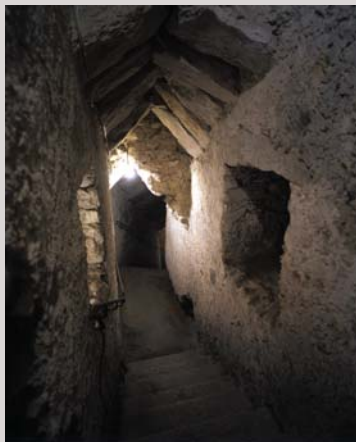
Escales d'accés a la cisterna Escaleras de acceso a la cisterna Stairs leading to cistern