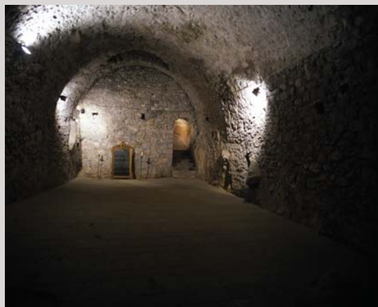
Sala la Carbonera Sala la Carbonera Room coal cellar