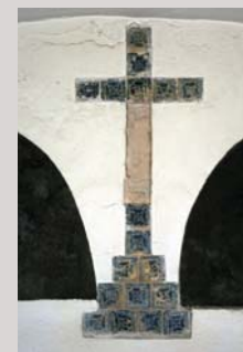
Detall de la creu Detalle de la cruz Close up of cross