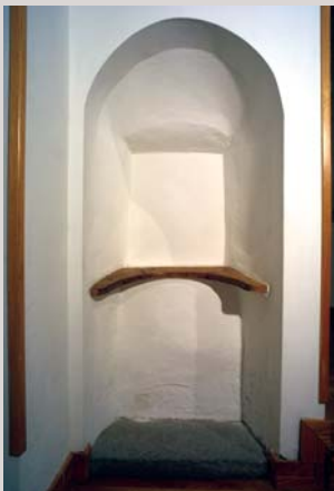
Antic confesionari del convent (segle XVIII) Antiguo confesionario del convento (siglo XVIII) Friar monastery's old confession box (18th Century)