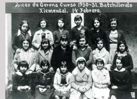
Antics alumnes de l'Institut d'Ensenyament Secundari Antiguos alumnos del Instituto de Enseñanza Secundaria Secondary Education Institute's old students