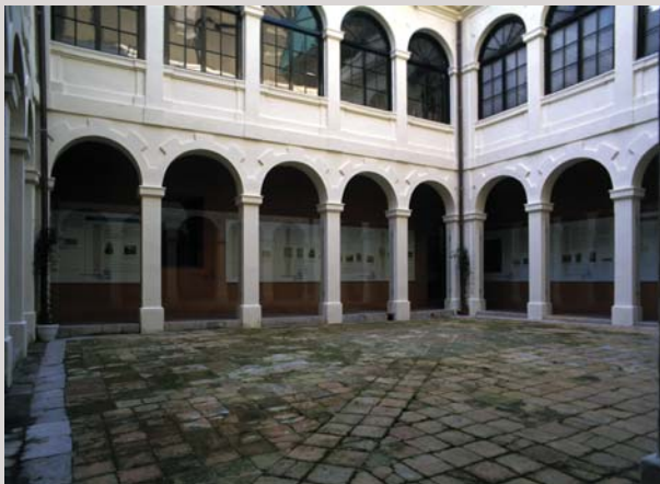
Claustre (segle XVIII) Claustro (siglo XVIII) Cloister (18th Century)