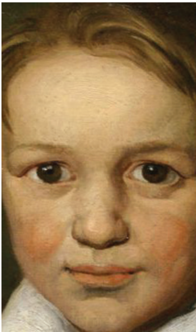
El jove Beethoven, amb només 13 anys.