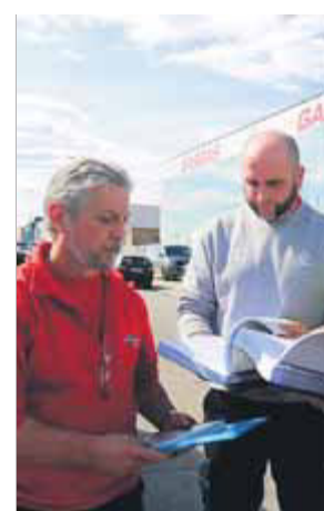
Els presidents del comitè d'empresa

tada serà la de Torrot (de la qual l'empresa vol fer fora setze treballadors). Els vuit restants formen part de Gas Gas. Durant la reunió d'ahir també es va constituir la taula negociadora, i ja s'ha marcat el calendari de reunions. La primera tindrà lloc dilluns vinent. Segons la UGT, la prioritat serà lluitar per intentar reduir l'afectació i aconseguir bones indemnitzacions per als treballadors que hagin de marxar i conèixer el pla de viabilitat que té l'empresa. ■