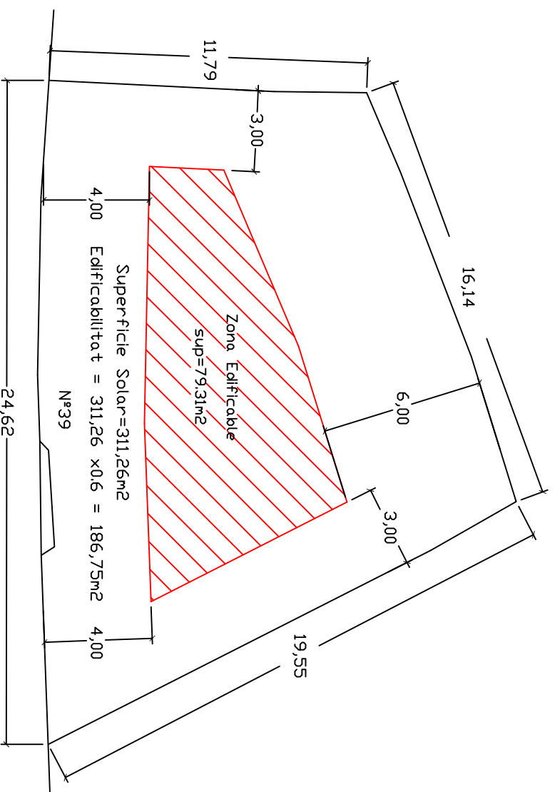
Carrer Sant Jordi nº 39 Zona de ciutat jardí - tipus 2 Normativa Subzona 2.2.b (VIGENT)