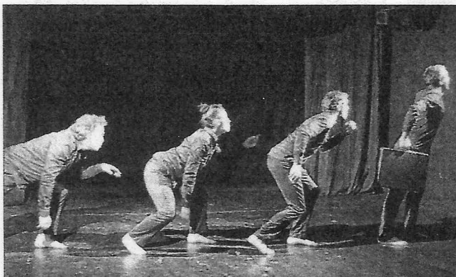
L'histoire de l'Homme et de son alimentation.

Un spectacle qui tour à tour fait rire, sourire, alarme mais en tout état de cause pose les vraies questions sur notre société de consommation. Que mange-t-on réellement ? Comment la nourriture animale ou végétale est-elle produite ? Distribuée ? Avec