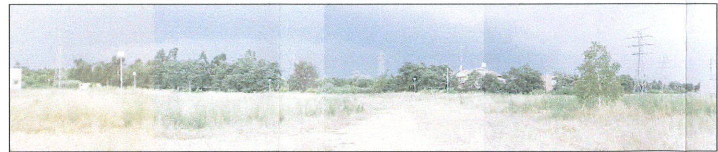
VISTA NÚM. 1