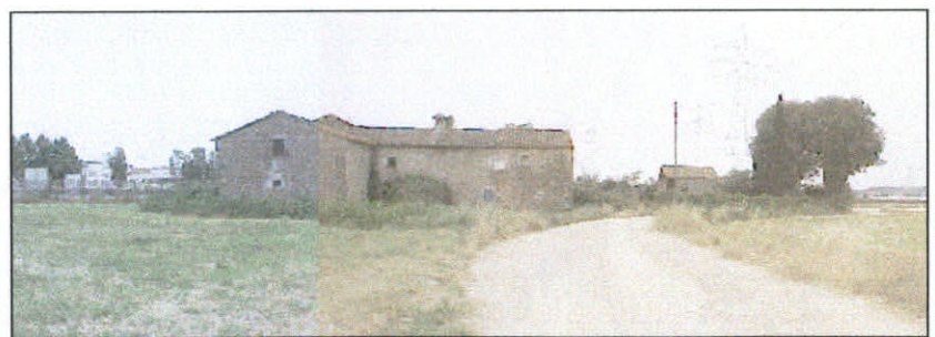
VISTA NÚM. 2