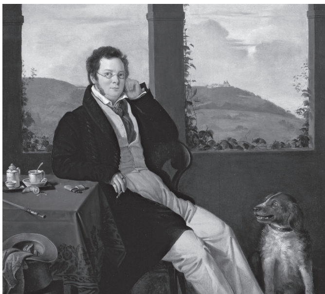
Retrat de Franz Schubert (1827)