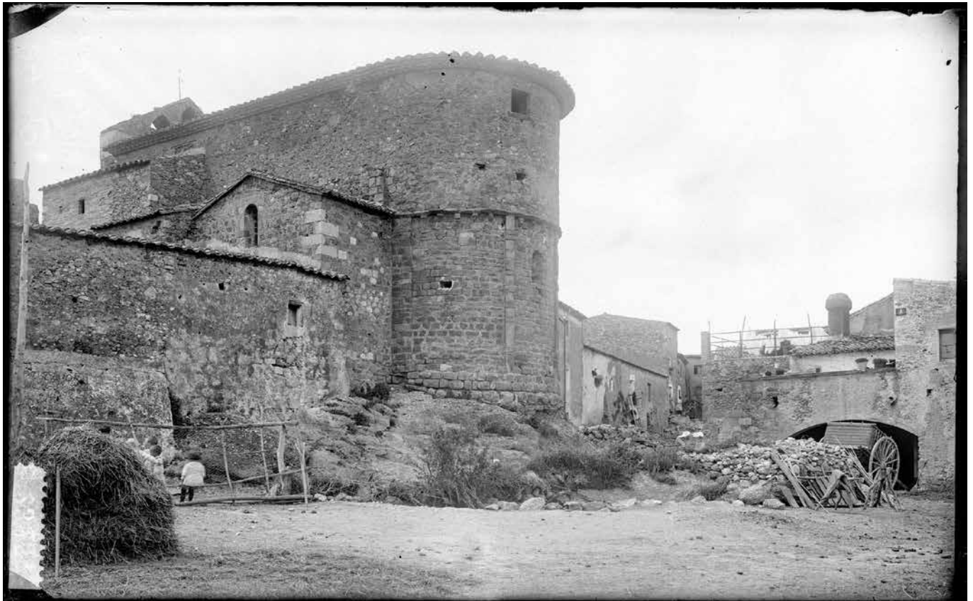
Institut Amatller d'Art Hispànic (Arxiu Mas: Valentí Fargnoli) - Ajuntament de Girona-CRDI (1918). Vista exterior de l'absis de l'església de Sant Miquel de Tor. Com podem apreciar, l'entorn avui en dia és molt diferent.