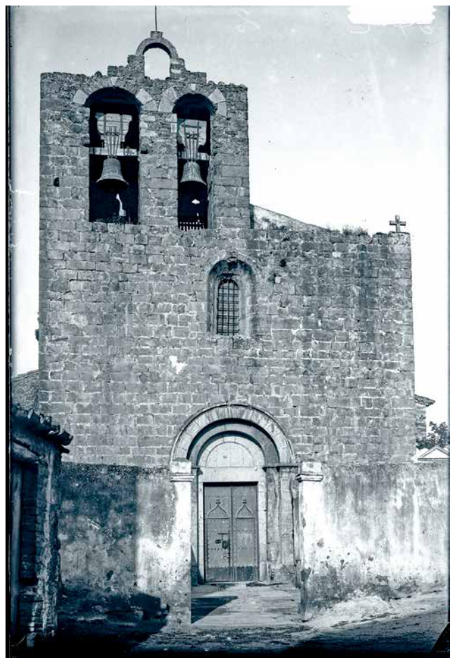
Reg. 805414/15, 806037. Institut Amatller d'Art Hispànic (Arxiu Mas: Valentí Fargnoli) - Ajuntament de Girona-CRDI (1918). Vista general de l'església i façana de Santa Maria de la Tallada. En aquestes fotografies podem observar com encara no existia el rellotge del campanar i com hi havia un mur perimetral al voltant de l'església, que probablement pertanyia a l'antic cementiri.

No sabem si és perquè el fotògraf buscava una referència d'escala en les seves fotografies o perquè la gent estava interessada a participar en un esdeveniment excepcional com era la visita d'un fotògraf, o ambdues coses alhora, el cas és que en les fotografies apareix gent anònima.