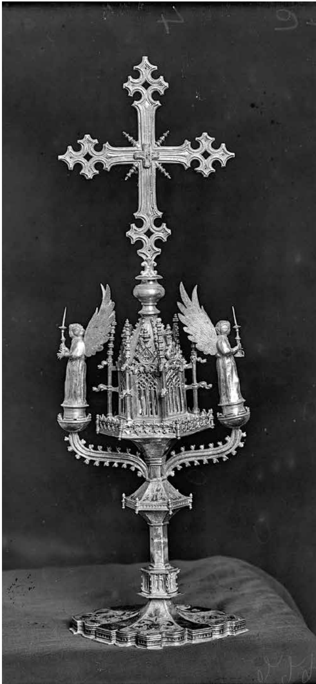
Reg. 805420. (1918). Creu, amb dos àngels i una arqueta, de l'església de Santa Maria de la Tallada.

A banda de fotografiar art moble, Valentí Fargnoli també va fotografiar diferents monuments de la Tallada i Tor. L'objectiu no només eren les esglésies romàniques, sinó també diferents parts del recinte emmurallat de la Tallada, cosa que ens permet establir una comparativa entre com eren abans de 1918 i com són actualment. Salta a la vista les transformacions que, tant aquests elements com el seu entorn, han sofert al llarg d'aquests 101 anys.