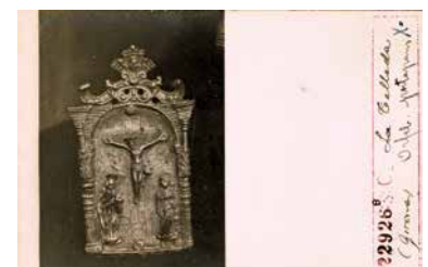
Reg. 805417/19. Institut Amatller d'Art Hispànic (Arxiu Mas: Valentí Fargnoli) - Ajuntament de Girona-CRDI (1918). Es tracta d'un negatiu i dues còpies positives de dos objectes litúrgics de l'església de Santa Maria de la Tallada. L'objecte A és una naveta (vas en forma de nau on es guarda l'encens per a les cerimònies del culte) i l'objecte B, d'un "portapans" (recipient que conté les hòsties consagrades).