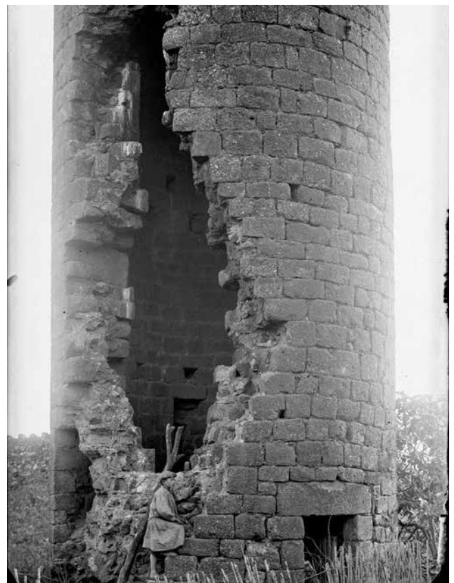
Reg. 805422, 805424. Institut Amatller d'Art Hispànic (Arxiu Mas: Valentí Fargnoli) - Ajuntament de Girona-CRDI (1918). Mainada al pont (avui en dia desaparegut) de la Torre del Portal de la Tallada, i nen a la Torre de can Japot de Dalt (l'esvoranc encara no havia estat restaurat).