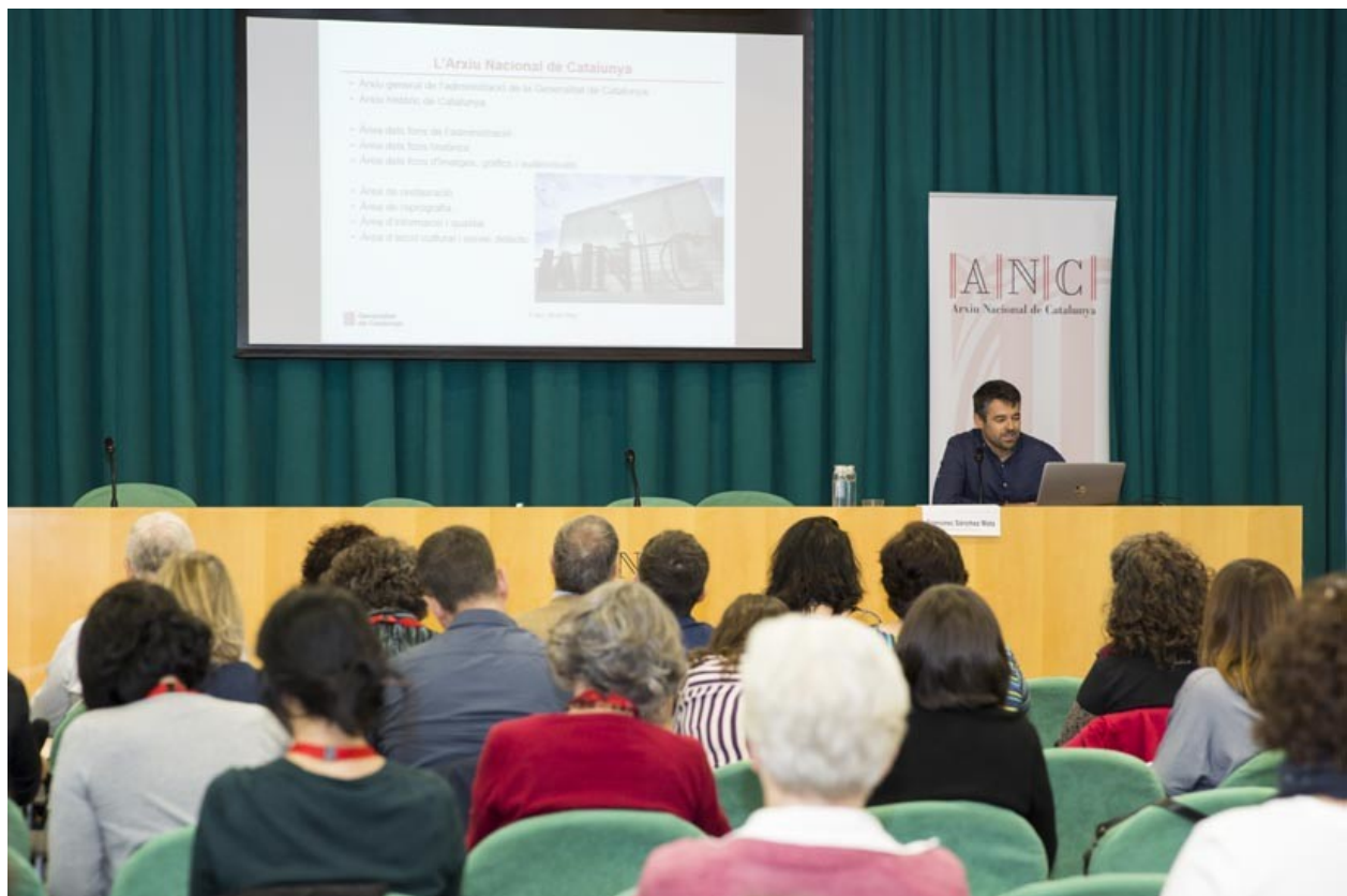
Jornades sobre el Patrimoni Sonor i Audiovisual | Arxiu Nacional de Catalunya

En aquestes jornades s'ha posat de manifest, un cop més, la vulnerabilitat del patrimoni sonor i audiovisual i s'ha constatat que les estratègies per protegir-lo estan estretament relacionades amb l'aparició de les noves eines tecnològiques i els nous enfocaments per afrontar el repte de la preservació digital.