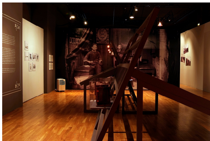
Ajuntament de Girona. CRDI (Josep Maria Oliveras). 2008

La procedència de fons fotogràfics és divers i en alguns casos, no del tot excepcionals, es rescaten materials de considerable valor de les runes. En aquestes situacions i en funció de les vicissituds de les fotografies, la intervenció d'un restaurador de fotografies es fa imprescindible.