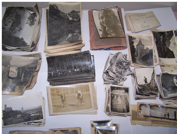
Ajuntament de Girona. CRDI (Dif). 2007

La procedència de fons fotogràfics és divers i en alguns casos, no del tot excepcionals, es rescaten materials de considerable valor de les runes. En aquestes situacions i en funció de les vicissituds de les fotografies, la intervenció d'un restaurador de fotografies es fa imprescindible.