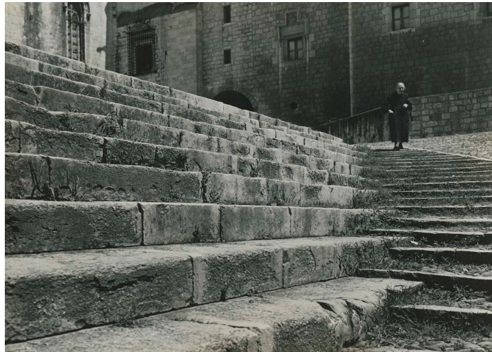
BM0030. Anciana baixant les escales de la plaça dels Apòstols. 1956. Negatiu, còpia de treball i positiu 18x24 presentat a concurs.