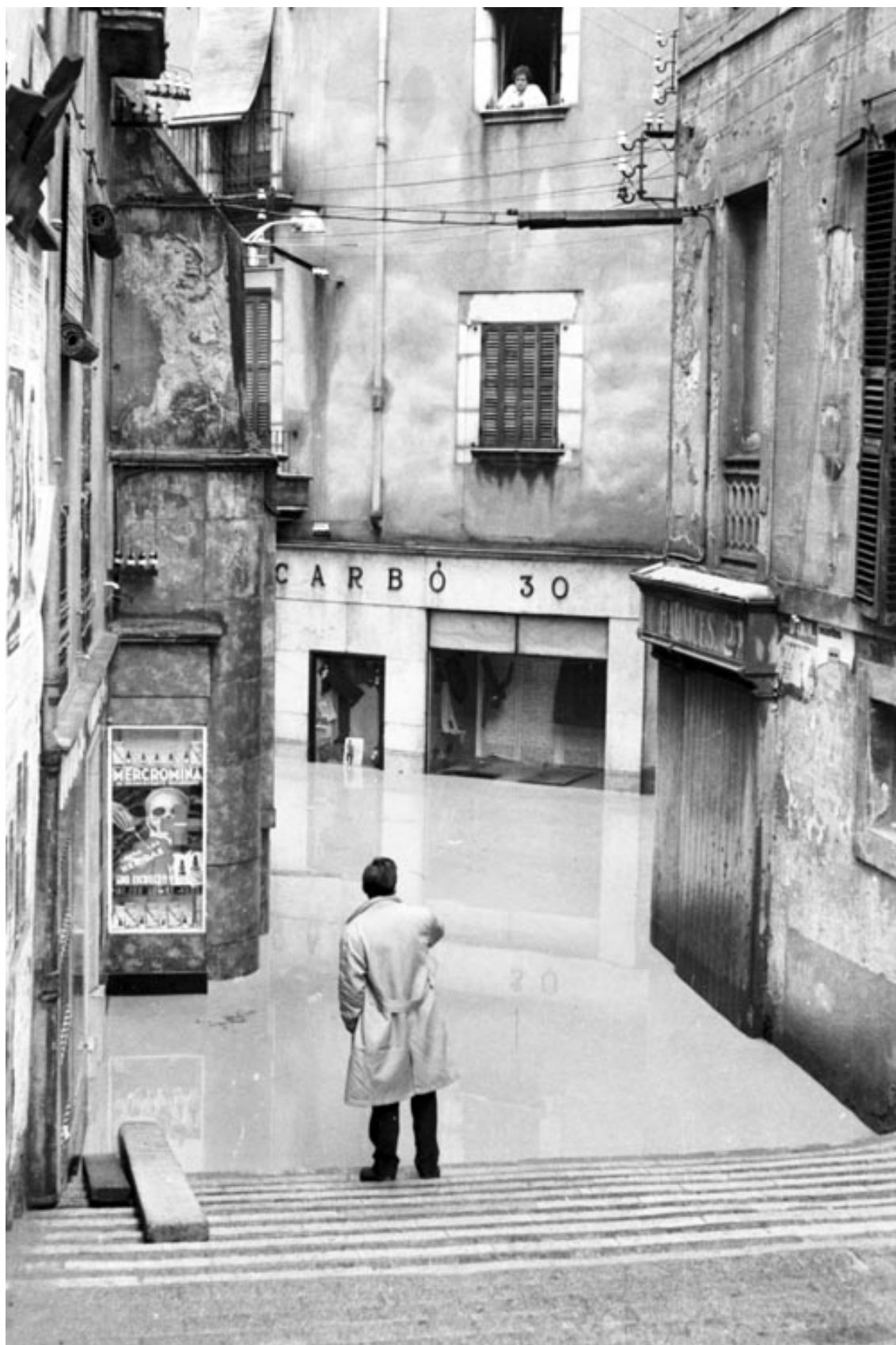
Inundacions a la ciutat de Girona. 1962.