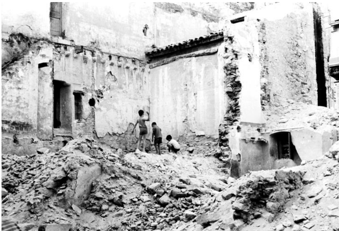
Nens jugant entre les runes d'un edifici enderrocat. 1968 ca.

Un fet decisiu per a la professionalització de Josep Buil va ser l'arribada a Eivissa que va tenir lloc el 1970 de la mà de l'editorial Everest. Aquesta li va contractar una nova guia turística, en aquesta ocasió sobre Eivissa i Formentera, indrets que apuntaven com a centres turístics emergents. Eivissa havia de ser l'escala professional en el seu camí cap a Veneçuela, però sembla ser que a l'illa hi va trobar els incentius professionals i personals que l'havien de portar a establir-s'hi definitivament. D'aquesta manera s'allunyava de la seva ciutat natal, amb la qual mantindria el vincle a través del seu llegat fotogràfic, cedit a la ciutat a partir de 1994.