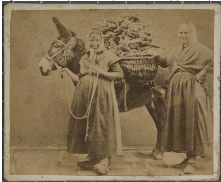
Figuras 4, 5 e 6: [Dones transportant rabasses] (ca. 1890), autor desconhecido; e detalhes do suporte.

Nas figuras adiante, os detalhes observados diretamente do original, como o tom da imagem, a espessura do papel e a presença de suporte secundário, são identificadores do procedimento albuminado. A visão da superfície ampliada em 30 vezes e o corte de seção (feito pelo Image Permanence Institute - IPI) fornecem informação adicional para a identificação.