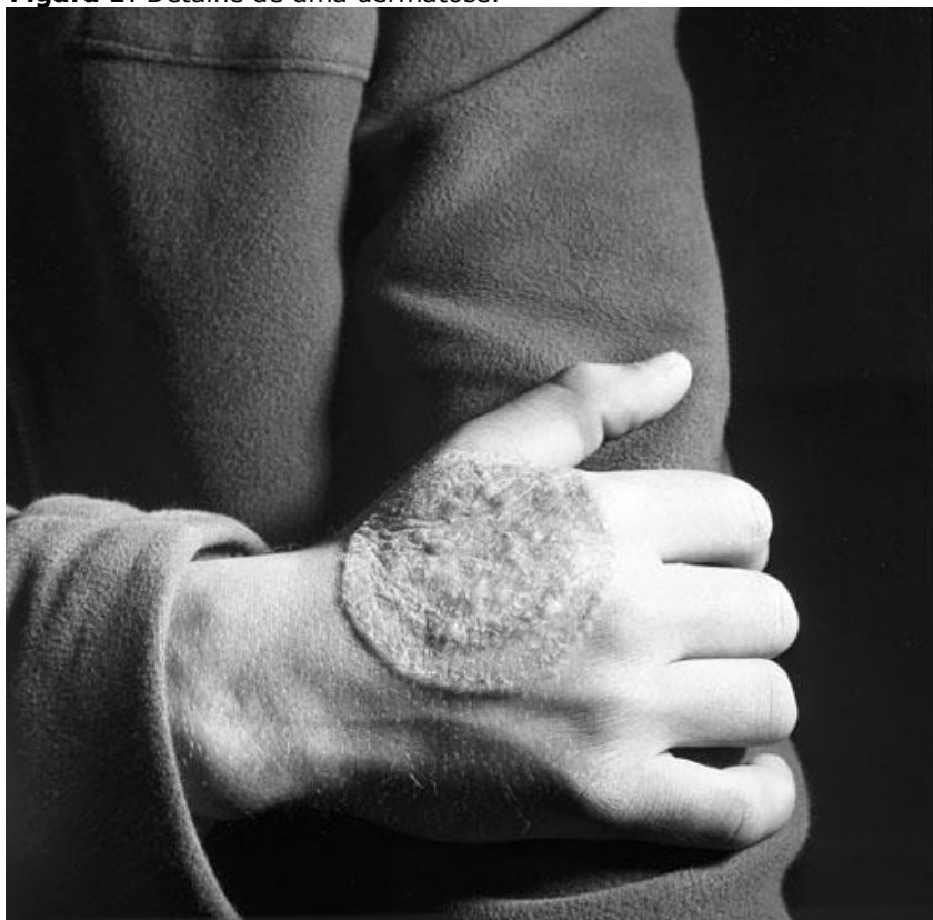
Figura 1: Detalhe de uma dermatose.