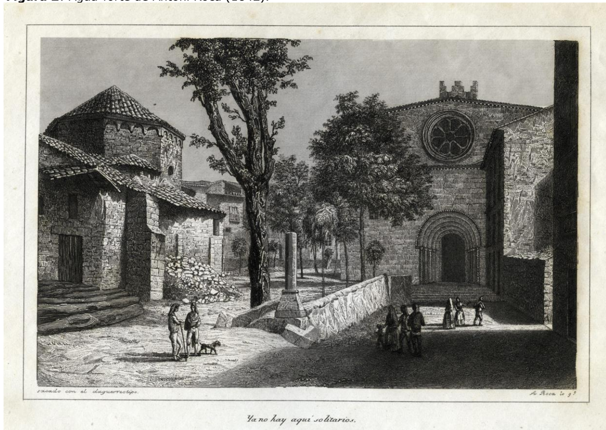
Figura 2: Água-forte de Antoni Roca (1842).