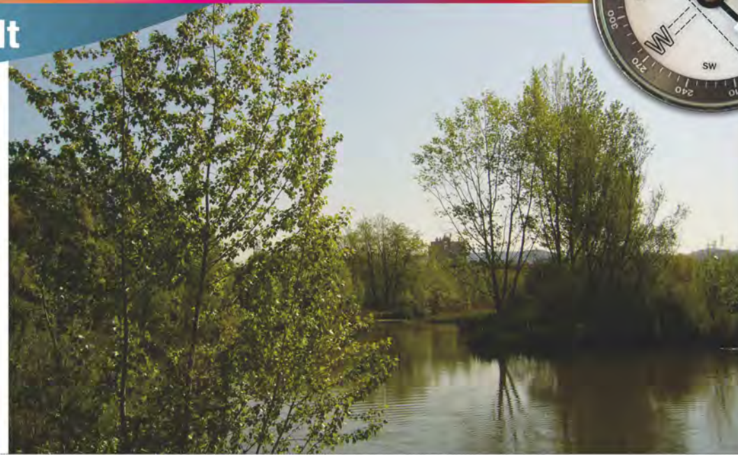
Dipòsit legal GI 735-2015 - Disseny gràfic: CreatiusGirona

Les vostres dades personals s'incorporaran al fitxer automatitzat Inscripció a activitats municipals de l'Ajuntament de Girona únicament per a la gestió del concurs Descobriu Girona, en compliment de la Llei orgànica 15/1999, de 13 de desembre, de protecció de dades de caràcter personal. Podreu exercir-ne el dret d'accés, modificació, cancel·lació del servei i oposició per telèfon 972 01 00 01, correu electrònic turisme@ajgirona.cat o correu postal especificant Àrea de Promoció i Ocupació (Plaça del Vi, 1, 17004, Girona).