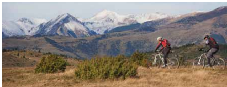
BTT al coll d'Ares, Ripollès-Vallespir.

A Girona, la Costa Brava es fon amb les muntanyes de les Gavarres i el Pirineu a través de rutes molt atractives que comencen i acaben a poblacions com Calella de Palafrugell, Castell-Platja d'Aro, Sant Feliu de Guíxols, Lloret de Mar o Blanes. Des de la costa del Maresme –amb Malgrat de Mar, Santa Susanna i Calella com a punts de partida– una anella verda uneix cinc parcs naturals que envolten Barcelona, amb paratges tan emblemàtics com el Montseny, el Montnegre o Montserrat. Al sud, el litoral de Tarragona és la porta d'entrada a les carreteres bucòliques del Montsant, la serra de Prades i els Ports de Tortosa-Beseit, des de Cambrils, Montroig del Camp, Miami Platja i Sant Carles de la Ràpita.