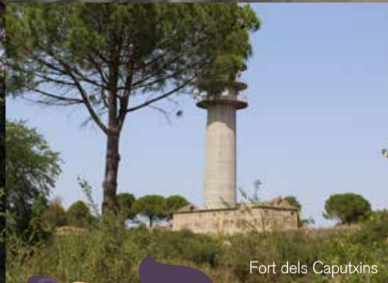
Fort dels Caputxins

DL Gi 91-2021