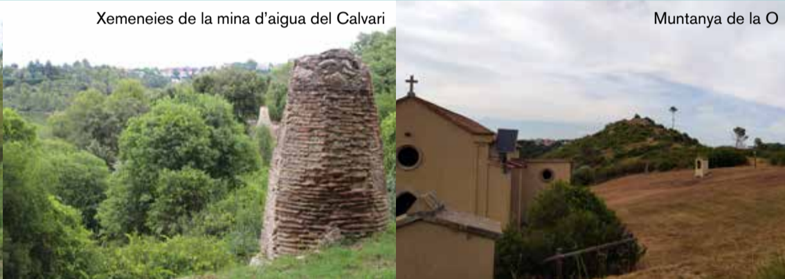
Xemeniees de la mina d'aigua del Calvari