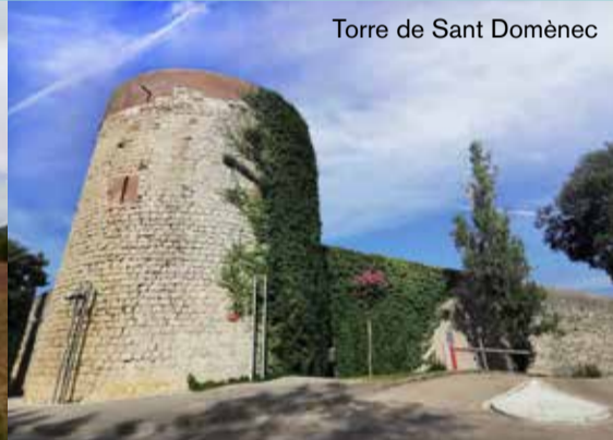
Torre de Sant Domènec