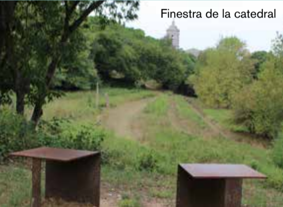
Finestra de la catedral