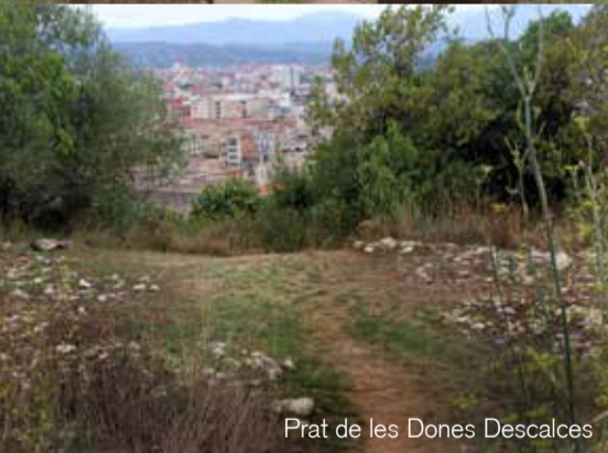
Prat de les Dones Descalces