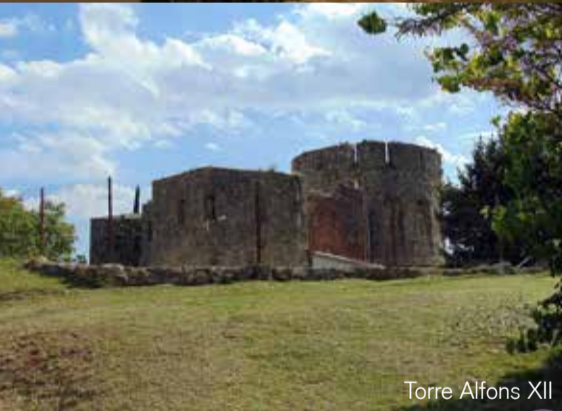
Torre Alfons XII