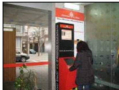
Caixer piscina Can Gibert del Pla