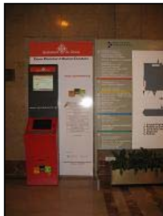
Caixer hospital J. Trueta