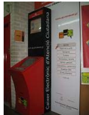
Caixer C.C. Onyar