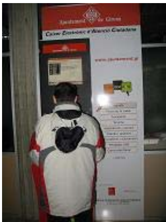
Caixer pavelló de Palau

A part dels 5 Caixers Electrònics d'Informació i Atenció Ciutadana, l'Àrea de Promoció de la ciutat també té implantada una xarxa de Caixers més enfocats a turisme.