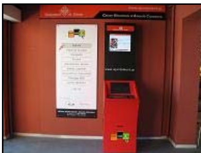
Caixer mercat del Lleó