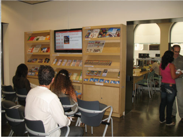
Font: Ajuntament de Girona