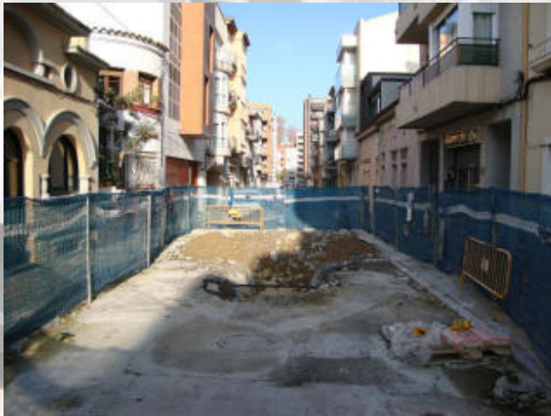
Carrer Francesc Rogés