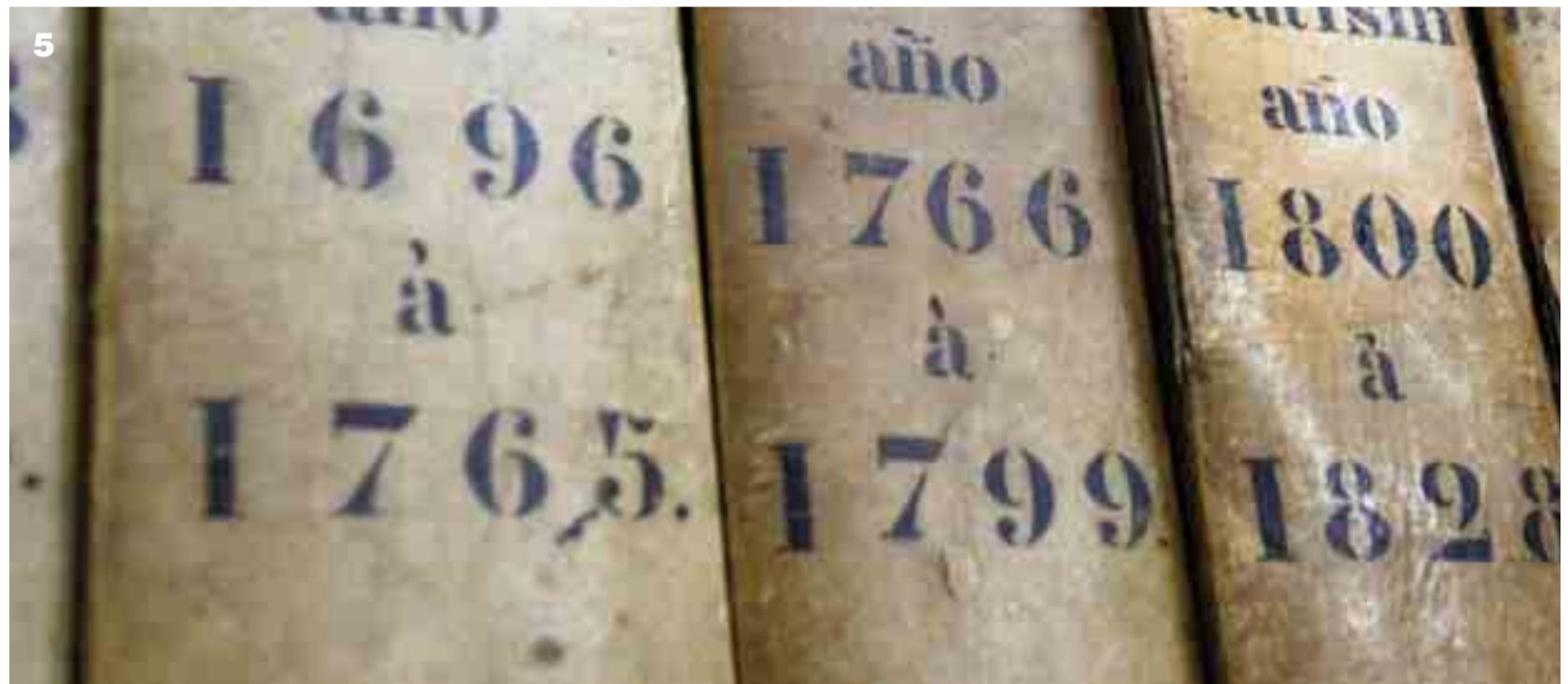
Fotos: A sobre d'aquestes línies, un dels volums conservats a l'Arxiu Diocesà —amb gravats d'or— i un mapa pertanyent al mateix servei. A sota, material de l'Arxiu Municipal corresponents als setges.