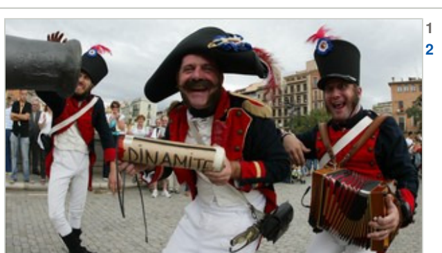
Durant la primera jornada de la festa es faran recreacions històriques pel Barri Vell de Girona.

Nota: El Grup El Punt adverteix que no es responsabilitza dels comentaris fets pels usuaris ni els comparteix perquè enten que són responsabilitat exclusiva de llurs autors. Per això, cada comentari es publicarà sempre amb el nom i els cognoms de