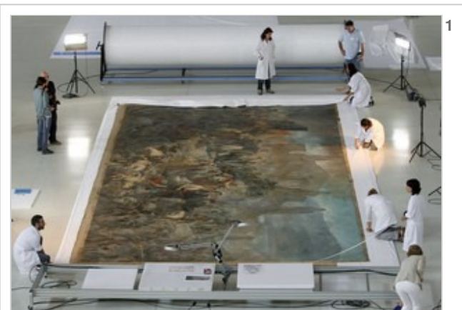
Les feines d'enrotllament del quadre, dimecres a la Sala Oval del MNAC.

Més enllà del redescobriments d'un quadre, doncs, és tota una època la que ens demana ser reexaminada; l'esforç haurà valgut la pena si, una vegada el quadre estigui de nou penjat, tots plegats coneixem una mica més