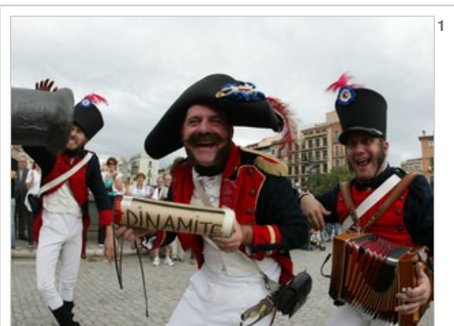
Una imatge de la festa napoleònica de l'any passat.

L'Ajuntament de Girona organitza, per segon any consecutiu, la festa Reviu la història dels setges napoleònics , sota el lema La guerra del francès torna a Girona , que tindrà lloc aquest dissabte i diumenge amb diverses activitats. La festa té per objectiu donar a conèixer aquesta part de la història de la guerra del Francès a la ciutat i també la part pedagògica d'aquella època, i al mateix temps contribuir a fer que els visitants puguin gaudir de la Devesa. Els actes començaran dissabte a les cinc de la tarda amb una desfilada de grups de recreació històrica pels carrers del Barri Vell. Diumenge es faran actes a la Devesa durant tot el dia.