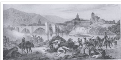
'Vue de Bezalu', de Jean-Charles Langlois (1826-1830) és una de les il·lustracions que apareix al catàleg.