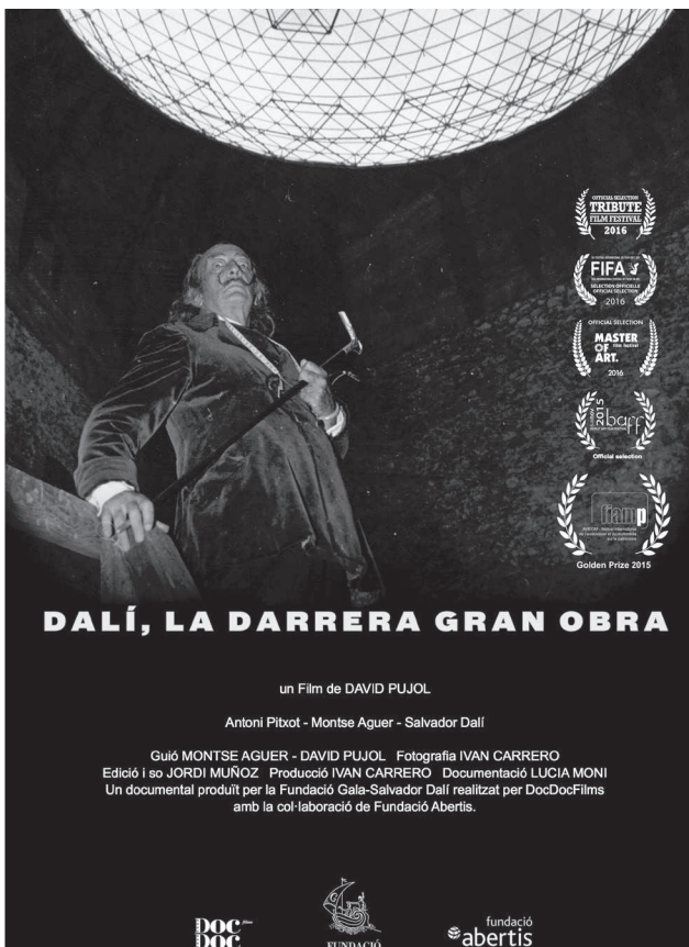
DVD. Dalí, la darrera gran obra, © Fundació Gala-Salvador Dalí, Figueres, 2016. Drets d'imatge de Salvador Dalí reservats.

solament pel seu origen o pel llegat del pintor, sinó per les tasques com a creador i curador de continguts artístics que ha anat exercint al llarg de la història. El motiu de la nostra xerrada és parlar-vos d'ambdues vessants, la documental i la curatorial.