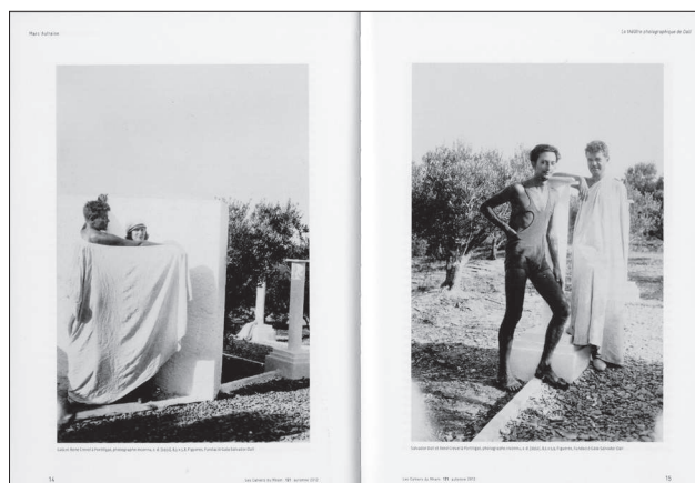
Les Cahiers du Musée National d'Art Moderne, tardor de 2012. Drets d'imatge de Salvador Dalí reservats. Fundació Gala-Salvador Dalí, Figueres, 2016.

pensada des del CED i elaborada únicament amb els nostres fons. Presentada en les antigues sales noves del Teatre-Museu el 1998, durant l'any següent va poder ser visitada a Tarragona, Lleida, Granollers i Jerez de la Frontera; el 2000, al Museu de Cadaqués, i el 2001, al Museu d'Art Modern de Ceret.