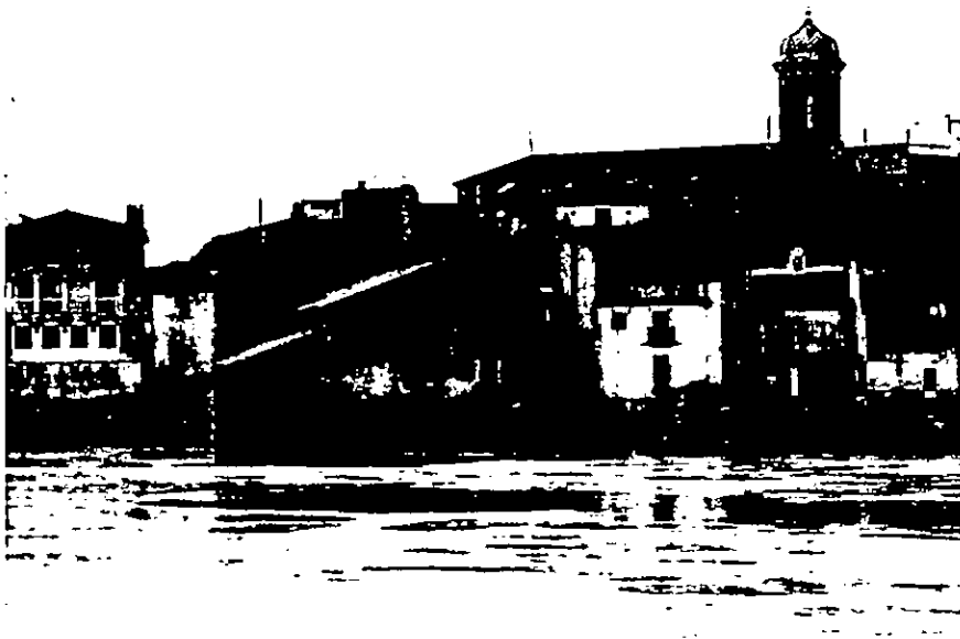
Portada del llibre Amposta. Imatges per a la història. 1870-1969 .

AMPOSTA. Imatges per a la història. 1870-1969