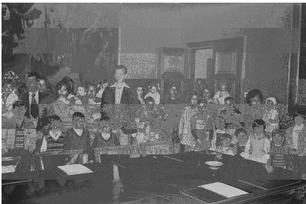
[Premis Provincials de Promoció Familiar] 1/5/1977

La datació és l'única relació entre les fotografies de la manifestació del Primer de Maig i la concessió dels premis de natalitat. Gairebé podríem dir que són dos esdeveniments antagònics, però el vincle cronològic no és atzarós: la raó de ser d'ambdós actes parteix de la mateixa voluntat de commemoració. El nexa posa en relleu l'existència d'una visió fragmentada de la realitat i ens dona una idea aproximada del context social i polític retratat.