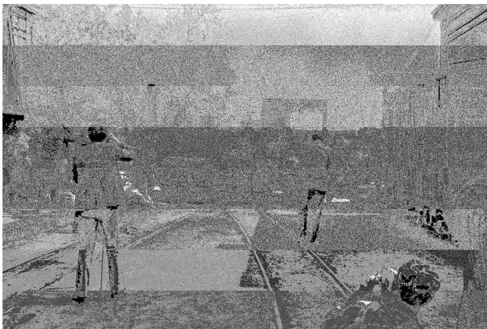
Tren de Sant Feliu 10/4/1969

El reportatge fotogràfic de Juli Torres Monsó (Girona, 1925-1999) deixa constància d'aquest comiat. Aquell dia, el fotògraf va acostar-se a la Estació de Girona per fotografiar la darrera encaixada de la locomotora del Feliuet amb els vagons que cobrien el servei. Va compartir el ritual acompanyat de periodistes, fotògrafs i curiosos. Al llarg del trajecte, també va retratar la multitud a les estacions de Quart, Cassà de la Selva, Llagostera, Santa Cristina d'Aro, Llambilles i la Font Picant. Concedint tota l'autoritat a la fotografia, una línia ferroviària en declivi semblava morir d'èxit.