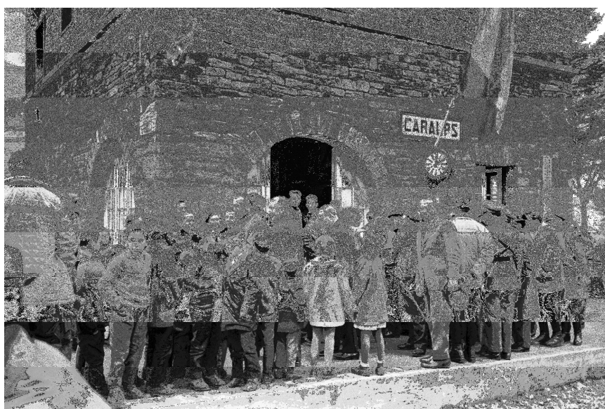
Ministro de Información y Turismo 16/3/1965

La fotografia escollida és l'arribada de les autoritats a l'estació del ferrocarril de Queralbs, a punt per agafar el tren cremallera fins a Núria. El nivell icònic implica tots aquells elements morfològics aïllats del conjunt de la imatge: una estació de ferrocarrils, un ministre de govern, la guàrdia civil i un bon grapat de curiosos, sobretot mainada. El nivell descriptiu agrupa totes aquestes unitats mínimes de significat per conformar una escena lògica: « El ministre d'Informació i Turisme, Manuel Fraga Iribarne, a l'estació del Ferrocarril de Queralbs. Al seu costat, guàrdia civils i un nombre considerable de persones, sobretot infants.» Finalment, el nivell narratiu vincula l'instant temporal amb la resta de seqüències del reportatge: «Un grup nombrós de persones a l'estació del Ferrocarril de Queralbs durant la visita oficial del Ministre d'Informació i Turisme, Manuel Fraga Iribarne, a les comarques gironines. La comitiva espera l'arribada del tren cremallera per visitar el Santuari de Núria. A la dreta, un grup de guàrdia civils.»