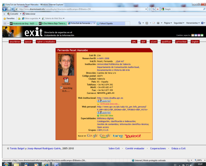
Figura 2. Ejemplo de ficha de EXIT. http://www.directorioexit.info