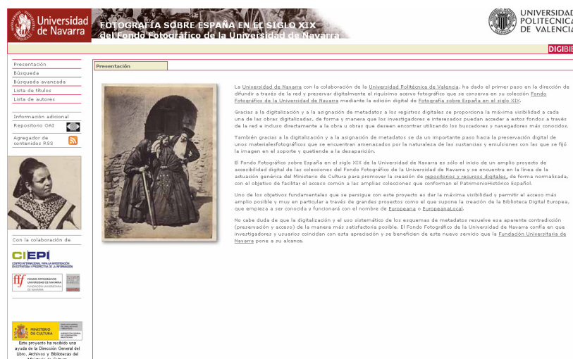
Figura 1. Fotografía sobre España en el siglo XIX http://coleccioniff.unav.es/bvunav/

El contexto de nuestro proyecto se encuentra en el trabajo previo desarrollado en el campo de la fotografía para rescatar y hacer visibles en Internet las colecciones que lo permitan. Concretamente desde 2007 hasta ahora pusimos en marcha la distribución de la colección Fondo Fotográfico Fundación Universidad de Navarra, gracias a una ayuda parcial de la Subdirección General de Coordinación Bibliotecaria del Ministerio de Cultura, utilizando un protocolo que fomenta la visibilidad de la información en Internet –Open Archives Initiative-Protocol for Metadata Harvesting–. Desde ese momento comprobamos la falta de visibilidad en Internet del patrimonio fotográfico español y detectamos la necesidad de identificar otras colecciones.