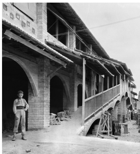
Málaga. Fábrica de ladrillos y tejas Cerámica Santa Inés. Años 30, siglo 20.

El archivo fotográfico del CTI-UMA cuenta con aproximadamente medio millón de fotografías; de una parte, fondos y colecciones históricas producidas entre finales del s.XIX y los años ochenta del pasado siglo: Bienvenido-Arenas (ca.1918-ca.1982) y Diario 16 Málaga (1974-1996); una copia digital de las fotografías de Andalucía de los fondos Thomas (ca.1900-ca.1910) y Roisin (ca.1926-ca.1962), a partir de la colaboración con el Archivo Fotográfico Histórico del IEF; y como producción propia, los materiales fotográficos originados en el desarrollo de la actividad característica del CTI, entre ellos, la Enciclopedia Electrónica de Andalucía (1989-1992), el Atlas del Turismo Andaluz (1999-2001) o la fotografía institucional realizada para la Universidad de Málaga.