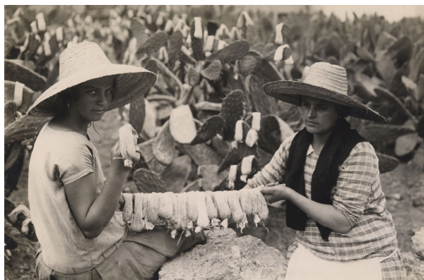
Jornaleras de la cochinilla. Arucas. Gran Canaria Teodoro Maisch. 1926. Gelatina

Archivo de Fotografía Histórica de Canarias FEDAC/CABILDO DE GRAN CANARIA