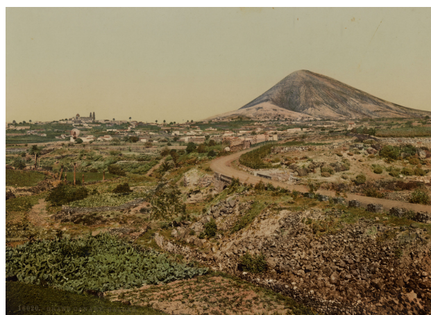
Plataneras de la Vega de Gáldar. Gran Canaria. Karl Norman. 1893. Albúmina iluminada