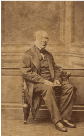
Conde de la Vega Grande Mayer and Pierson. Alb.CV Circa. 1865

El fenómeno fotográfico se extendió rápidamente por la isla; hacia finales del s. XIX ni los jornaleros pobres de las medianías de Gáldar pudieron esquivar el interés del objetivo de los fotógrafos, locales y extranjeros, que cada vez alcanzaban con sus cámaras rincones más recónditos de nuestra geografía. Es así como el retrato fotográfico, circunscrito hasta entonces a inmortalizar a la aristocracia insular en formato carta de visita, salió de los gabinetes fotográficos y extendió el ámbito social de la fotografía.