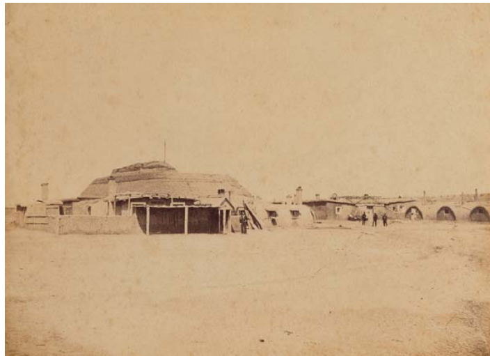
Poblado chino y barracones del ejército británico.