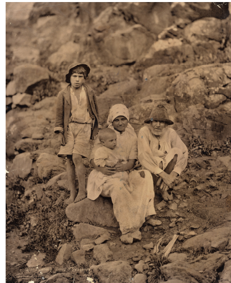
Los isleños. Gáldar. Gran Canaria Karl Norman. 1893. Alb.