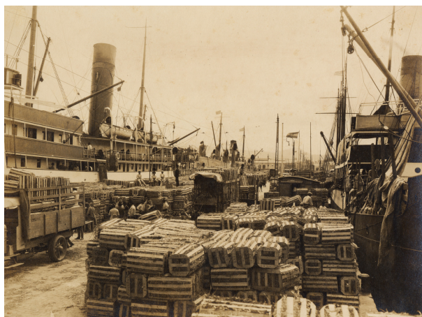
Huacales de plátano en el Puerto. LPGC Teodoro Maisch. 1928. Gelatina

Otros como el alemán Teodoro Maisch, que se afincó entre nosotros e instalándose en la capital de la isla contribuyó decisivamente a crear la imagen histórica que tenemos de los años 20 consolidando con la técnica de la gelatina el tipismo fotográfico que se había iniciado hacia finales del XIX con las copias a la albúmina. Formado en los círculos fotográficos alemanes, llega a Gran Canaria en los inicios de la segunda década del s. XX tras el fracaso de la Revolución e Alemania. Su objetivo fotográfico impulsó la renovación en la fotografía isleña; además de sus trabajos para diversas revistas y su vinculación con la Escuela Luján Pérez, puede considerársele el introductor de la "fotografía social" en Canarias. Su valiosa producción fotográfica se vio truncada con su repentina muerte tras ser interrogado por los militares españoles del Tribunal de la Represión de la Masonería y el Comunismo.