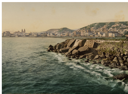
Refugio de San Telmo. Karl Norman. 1893 Alb ilum.

atlánticos de Madeira y Canarias con el fin de publicitar en Inglaterra los atractivos de ambos archipiélagos para la inversión de capitales. En el caso particular de Las Palmas de Gran Canaria, los progresos de su urbanización y la construcción de su Puerto de la Luz por la compañía británica Swanston and Company.