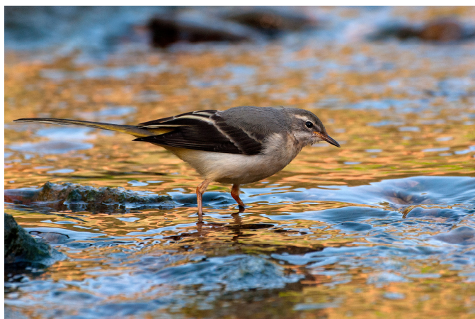
Cuereta Torrentera a la llera del riu Ripoll, 2011.

Quan la botiga li permet, Pere Monistrol compagina la seva passió per la natura amb la fotografia. Bon excursionista i coneixedor de la comarca del Vallès s'ha especialitzat en retratar fauna, i més concretament els ocells. Actualment centra la seva activitat en la llera del riu Ripoll, el delta del Llobregat i la Laguna de Gallocanta, una reserva natural de l'Aragó famosa per la migració de les grues procedents de la península Escandinava. També entre 1990 i 2011 va fer fotografia submarina.