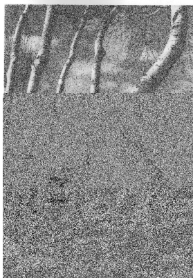
Fotografia de Pere Monistrol Masafret titulada " Albers " i publicada en el catàleg de la " International Exhibition of Pictorial Photography " de Dublín el 1947. Va ser realitzada al pas del riu Llobregat per la Bauma, prop de Montserrat.

En el camp de la fotografia, el major reconeixement a la seva obra li va arribar després de la Guerra Civil. L'any 1947 la Secció Artística del Cercle Sabadellès inaugurava una exposició amb fotografies de Pere Monistrol, Antoni Serra, Narcís Sardà, entre d'altres autors locals. Però el seu èxit més gran va ser l'adquisició de dues fotografies per la " International Exhibition of Pictorial Photography ", una exposició de fotografia pictorialista organitzada per la Societat Fotogràfica d'Irlanda a Dublín. En aquest certamen, que no tenia caràcter de concurs i per tant no es repartien premis, van concórrer 367 fotògrafs de 37 països diferents amb 1370 composicions. De les 213 fotografies admeses només 8 es van publicar en el catàleg. Espanya va ser l'únic país que es va veure honorat amb la publicació de dues imatges: Un retrat del mestre José Ortiz Echagüe titulat " Lino de duelo " i un paisatge de Pere Monistrol titulat " Albers ".