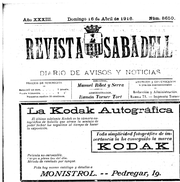
Portada de la Revista de Sabadell el 16 d'abril de 1916 on per primera vegada la botiga Monistrol anunciava la venda de càmeres i material fotogràfic.