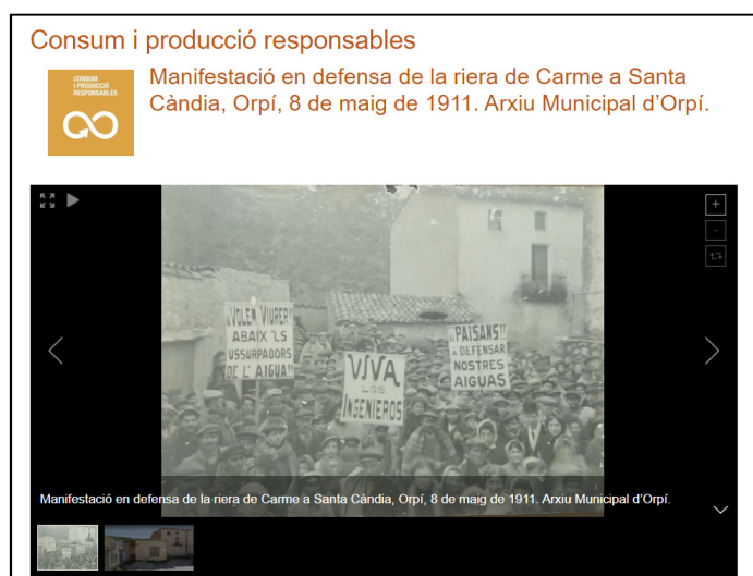
Figura 5. Docs XAM Agenda 2030. Objectiu: Consum i producció responsable. Diputació de Barcelona

Una altre acció destacada de divulgació conjunta és el que s'ha anomenat "Docs XAM Agenda 2030" xx . A partir dels disset objectius de desenvolupament sostenible aprovats per la ONU l'any 2015 per tal de ser assolits a nivell mundial l'any 2030, s'han escollit disset documents temàticament relacionats amb cada un dels objectiu, fent dialogar d'aquesta manera passat i futur. Els documents utilitzats són de tipologies i suports diversos, però la fotografia ha estat molt present. Per exemple, en el cas de l'objectiu "Consum i producció responsable" es va escollir com a document una fotografia de l'arxiu municipal d'Orpí, de l'any 1911, on apareixia una manifestació en defensa de la riera del Carme a Santa Càndia xxi . Cada document s'ha acompanyat d'una fitxa amb la informació de context, la fitxa descriptiva NODAC i la seva geolocalització.