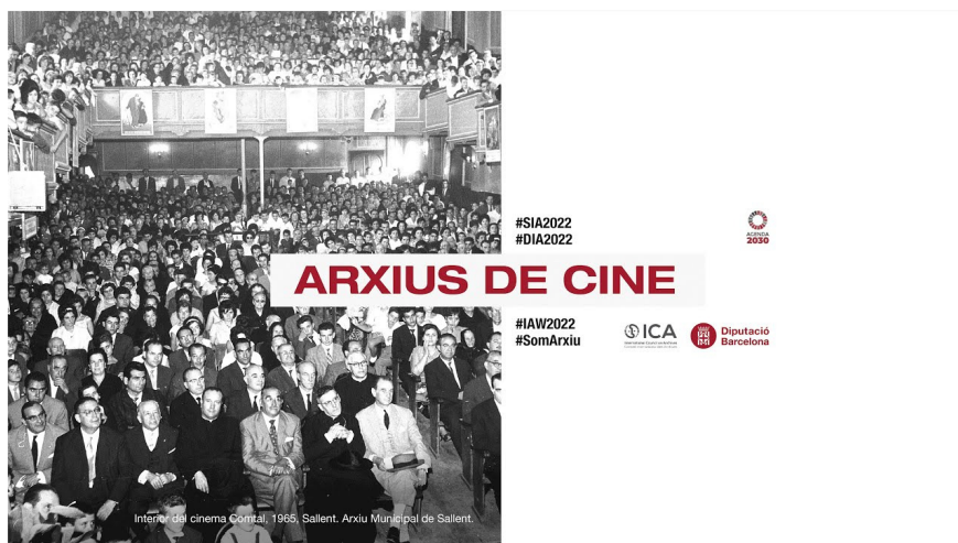
Figura 4. Material promocional de l'exposició virtual "Arxius de cine" organitzada per Diputació de Barcelona

s'enriqueixen mútuament els documents provinents dels arxius del Programa de Manteniment. Aquest any 2022, s'ha organitzat la desena exposició i la temàtica triada ha estat l'exhibició del cinema en l'àmbit local. Sota el títol "Arxius de cine" xix , i amb un pròleg del director de fotografia Tomàs Pladevall (premi Gaudí d'Honor 2022), s'exhibeixen un total de 81 documents provinents de 34 municipis menors de 10.000 habitants.