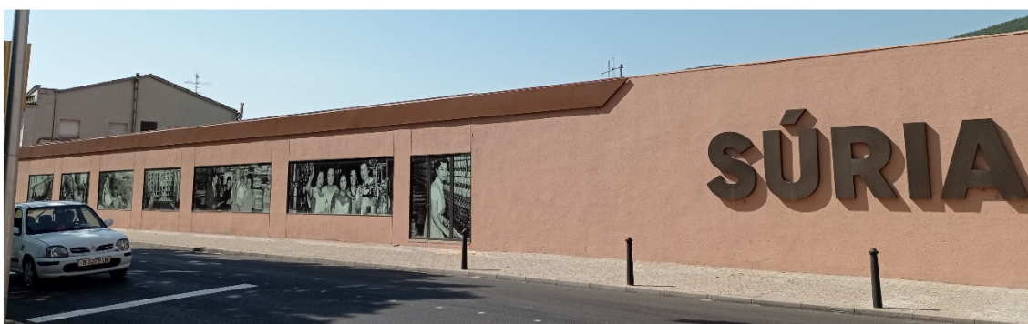
Figura 2. Nau industrial en una via d'accés a Súria decorada amb alguna de les fotografies del fons Fotografia Juncadella

Es tracta de dos fons de fotogràf local de la segona meitat del segle XX, similars a tants d'altres arreu del país. El fet diferencial a Súria és que, per les dimensions de la població (recordem que a Súria no superen els 6.000 habitants), són dos fotogràfs coneguts i referencials per al conjunt de la població. No deixa de ser significatiu que dues vies d'accés al municipi estiguin guarnides amb fotografies d'aquests dos fons. Fotografies destacades del fons "Fotografia Juncadella" s'han fet servir per decorar uns grans finestrals d'una nau industrial de propietat municipal situada en una via d'accés a la població. En un altre punt de la població, les fotografies del fons "Vila-Vers" decoren la paret d'una benzineria. Són exemples que, potser, poden sonar com a superficials, però que no ho són, ja que el fet que les fotografies, dipositades i conservades a l'arxiu municipal, tingui aquests grans aparadors a la vista de qualsevol ciutadà, denoten la importància que es dona al patrimoni fotogràfic local.