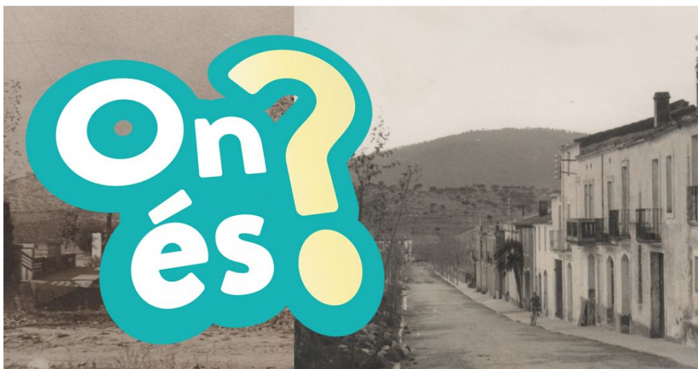
Figura 3. Imatge promocional de l'activitat a les xarxes socials "Begues. On és?". Ajuntament de Begues

d'aquestes xarxes l'ajuntament compta amb un perfil únic que crea continguts basats en tots els serveis i les activitats organitzades per l'ajuntament, inclòs l'arxiu municipal. L'arxiu hi col·labora de manera més o menys regular, especialment durant els mesos d'estiu. Una de les activitats destacades a xarxes durant els estius de 2020 i 2021 ha estat l'activitat "Begues. On és?", a partir de fotografies en blanc i negre del fons municipal i que induïa a la participació ciutadana per esbrinar l'espai del poble que apareixia representat xviii . Si analitzem l'exploració de les dades de xarxes duta a terme pel Departament de Comunicació de l'ajuntament, i comparem les interaccions a xarxes durant el mateix període amb altres publicacions d'altres temàtiques, les publicacions d'aquestes fotografies de l'arxiu van despertar més interès a l'hora de clicar, compartir i interactuar. Un exemple més de com la fotografia pot servir com element per atreure i donar a conèixer al públic el Servei d'Arxiu Municipal.