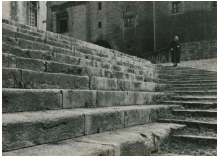
BM0030. Anciana baixant les escales de la plaça dels Apòstols. 1956. Negatiu, còpia de treball i positiu 18x24 presentat a concurs.