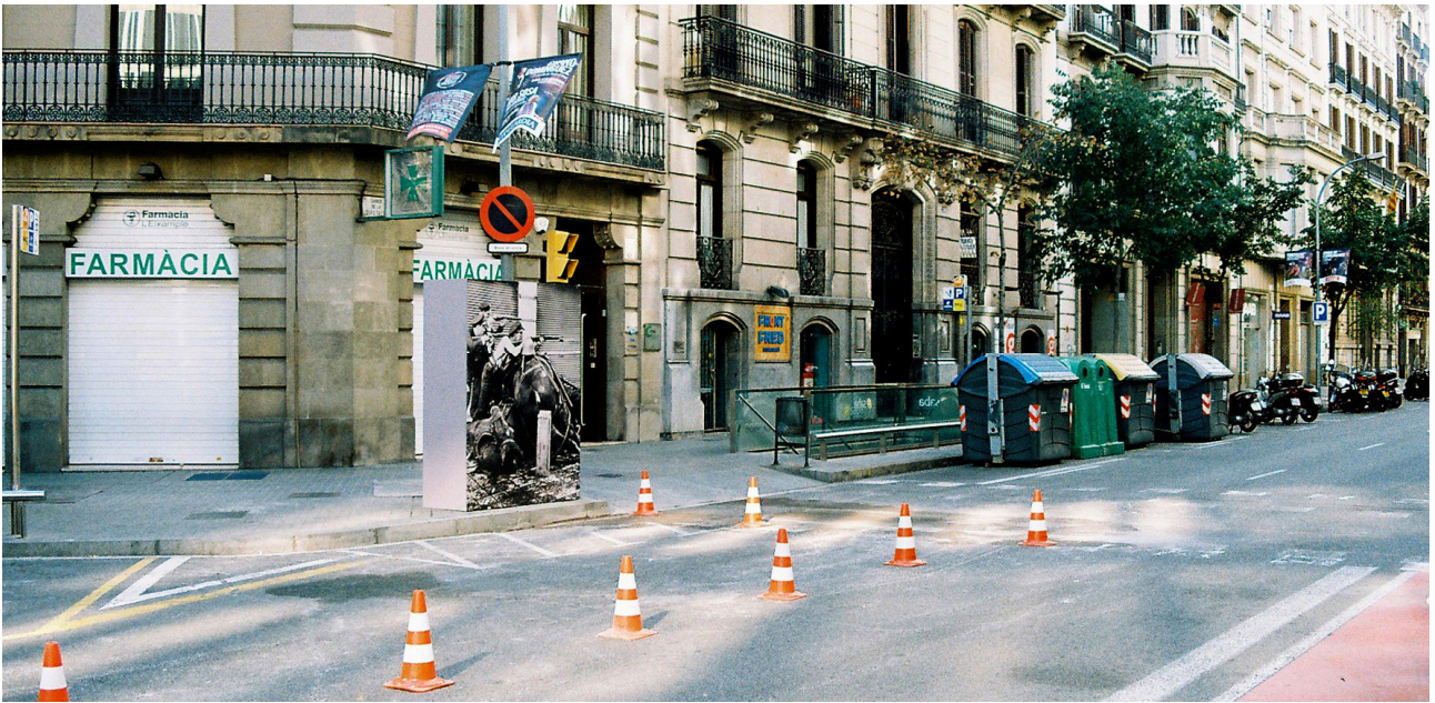
Restitució de la fotografia dels guàrdies d'assalt parapetats rere uns cavalls morts, a la cantonada de Diputació amb Llúria (instal·lació fotogràfica Forats de Bala , Barcelona, 2009).