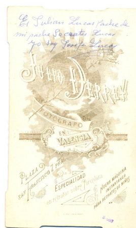
Información manuscrita con identificaciones