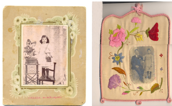
Soportes secundarios especiales