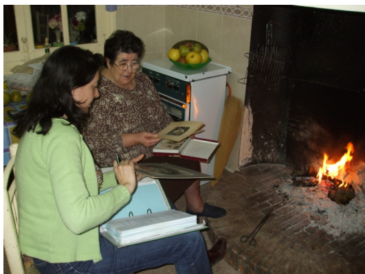
Identificación de las fotografías

Además de la datación y de la identificación de los lugares y los retratados, como hemos indicado anteriormente con posterioridad cotejábamos con otros informantes de cierta edad todos esos datos recogidos para completar las fichas descriptivas 10 .