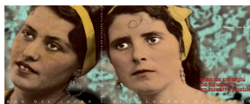
Cubierta de la publicación