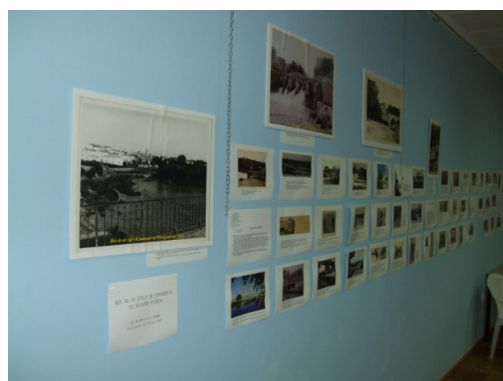
Montaje de la exposición en la Casa de la Cultura

En nuestro caso se solicitó una prórroga de un año. Esto se debió a que la fecha elegida para la exposición iba desde la Semana Santa hasta pasado el verano. El objeto de esta elección venía dado porque es la época del año en la que llegan al pueblo muchos vecinos emigrados. Y así tenían cabida posibles correcciones de datos y mejoras en la edición. El catálogo se imprimió a cuatro tintas con la mejor calidad sobre papel couché de un gramaje superior a 120 gr/m. Este está compuesto por las páginas de cortesía, una introducción y justificación de la obra. A continuación realizamos una historia de la fotografía relativa a nuestro pueblo, en la que haríamos una mención a los fotógrafos que trabajaron en el municipio. Explicamos el proyecto en el que haríamos mención a la estructura y división que hubo en la exposición y que se mantuvo en el catálogo. El cuerpo del libro se repartía en capítulos tales como vistas, calles y lugares; celebraciones religiosas,