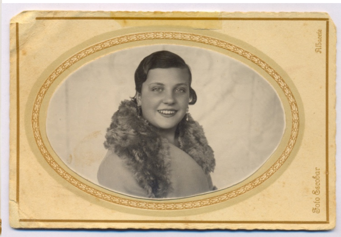
Retratos individuales, en grupo, posando