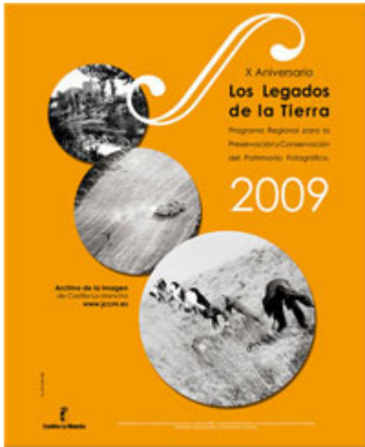
Cartel anunciador de la edición Los Legados de la Tierra del año 2009

Las ayudas para la organización de exposiciones fotográficas se valoraron a partir de la memoria-proyecto presentada en la solicitud y en función de distintos criterios, tales como la trayectoria profesional y experiencia del responsable técnico del proyecto, la localización, el material a recuperar, etcétera; se concedieron cuantías para cofinanciar los gastos derivados del montaje, reproducción y difusión de la misma. Sobre la naturaleza y características de las fotografías a exponer se primaban aspectos como la mayor antigüedad, titularidad y procedencia, clase de material, etcétera, y las temáticas referidas al patrimonio histórico-artístico, acontecimientos políticos, culturales, etnográficos, sociales y económicos de relevancia para la región. La cuantía iba destinada a cofinanciar los gastos derivados del montaje, reproducción, difusión de la exposición.