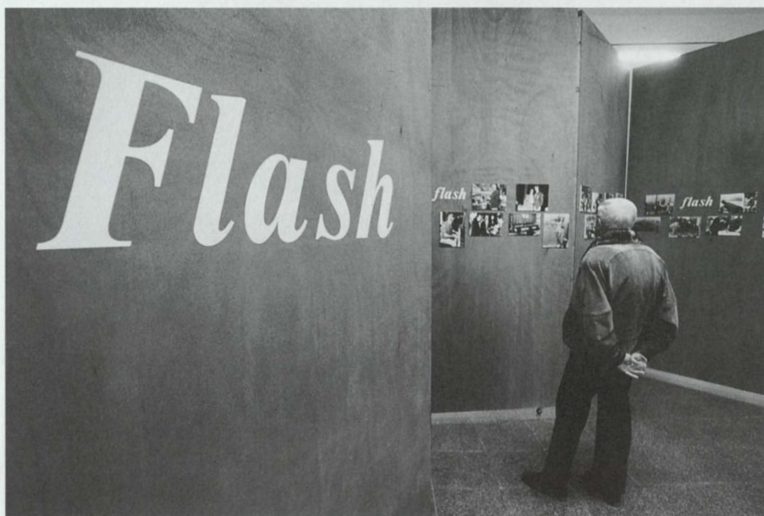
Exposició "Antoni Crosa Mauri, reporter de Palamós". Itinerari de flaixos.