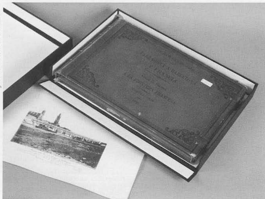
Àlbum del ferrocarril format per còpies a l'albúmina, de 1880. El 2004 es féu una intervenció sobre aquest àlbum que consistí en una simple neteja i la posterior instal·lació en una capsula de conservació fotogràfica. Actualment està ubicat als dipòsits freds del CRDI.

mina, que és el procediment en positiu més comú del segle XIX. Es tracta d'uns papers banyats en clara d'ou i sal amb una imatge final formada per clorur de plata. El seu aspecte és molt característic i actualment s'identifica també pel seu procés de deteriorament, que es pot detectar a ull nu a partir de l'esgrogueïment i el lleuger esvaïment de la imatge. Si tenim en compte que aquestes fotografies tenen més de 100 anys, les podríem considerar força estables, sobretot si ho comparem per exemple amb la fotografia en color dels anys setanta, però no se'ns pot escapar el detall que les pautes de deteriorament que experimenten en són claus identificadores. L'evolució d'aquest deteriorament porta inexorablement a la desaparició de les imatges. Cal, doncs, actuar.