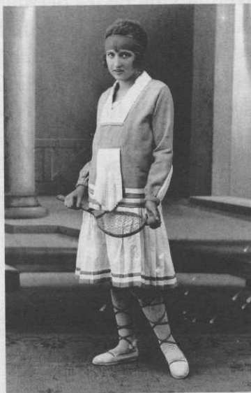
Retrat d'estudi d'una noia abillada de tennista (1920-1930).