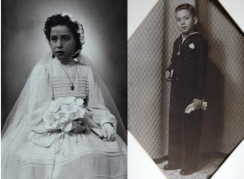
Retrats de Primera Comunió; la nen asseguda, el nen dret.

En un món fortament religiós en què ens movem arriba la cerimònia de primera comunió , la qual no, també actualment, no s'entén sense la imatge fotogràfica; aquí una gran galeria de personatges i la seva evolució al llarg dels anys desfilen en l'inventari. En els primers anys quaranta els nens estan drets amb els seus vestits impecables sobre fons neutres; cap al final de la dècada i ja fins als anys setanta hi ha tot un inventari de fons que evoluciona amb la moda; els nens amb els pantalons rectes i les nenes els volants ben marcats; els vestits masculins tenen èpoques i mentre als anys quaranta i cinquanta són elegants vestits amb corbata, al llarg dels anys següents predominarà l'estètica militar, preferentment marina, i curiosament els darrers anys ja es vesteix els nens amb pantalon curt.