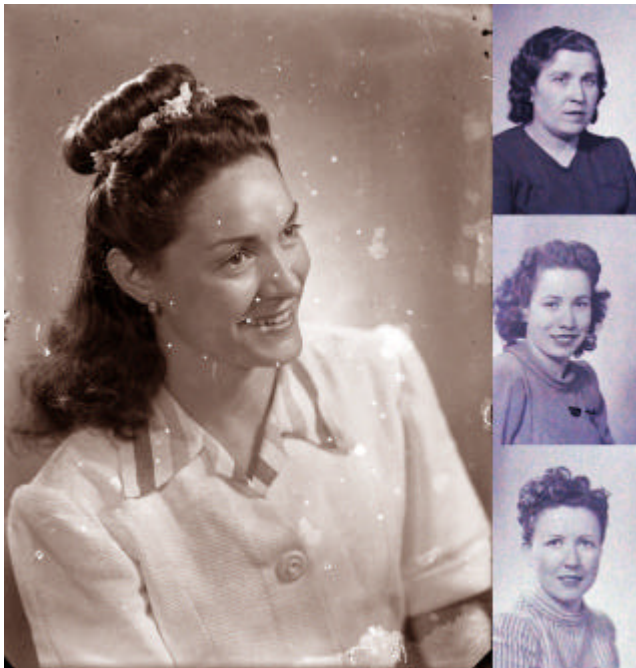
Diferència entre el creatiu retrat d'estudi (esquerra) i els retrats de carnet (dreta) ja normalitzats.

Finalment, cal apuntar que el fons de carnets consta de 79920 imatges identificades i d'uns 2500 sense referència (18)