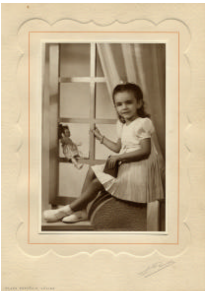
Imatge característica de nena amb una joguina sobre fons simulat.

Els nadons són un grup molt nombrós d'imatges, amb una estètica que va variant al llarg dels anys; en els primers mesos de vida es duia els bebès a l'estudi i se'ls guarnia amb els millors vestits, tot i que no era excepcional despullar-los però sempre amagant el sexe; cal fer notar que en molt casos és difícil esbrinar si és nen o nena i de fet l'única referència serà la presència d'arracades (30). Per al fotògraf els nadons sempre eren un repte important ja que difícilment es quedaven quiets, però els Porta sempre els captaven sobre un moble darrera del qual es podia amagar un familiar que el mantenia tranquil. El conjunt de nens i nenes ofereix curioses imatges; passen els anys i els fills creixen, s'ha de tornar al retratista, i així la galeria de personatges infantils és abundant; a partir dels cinc o sis anys difícilment es fotografien sols, perquè també és difícil que els matrimonis tinguin un fill sol; aquí els germans grans predominen sobre els petits, els tenen una joguina a la mà; i en el que avui diríem una distribució sexista, els nens tenen un cotxe i les nenes la coneguda nina. És curiós veure l'evolució de les joguines i advertim que a partir dels anys cinquanta hi ha una marcada influència cinematogràfica amb els ninots de Donald, Bambi o el ratolí Miki Mause, i curiosament els sostenen per igual nens i nenes.