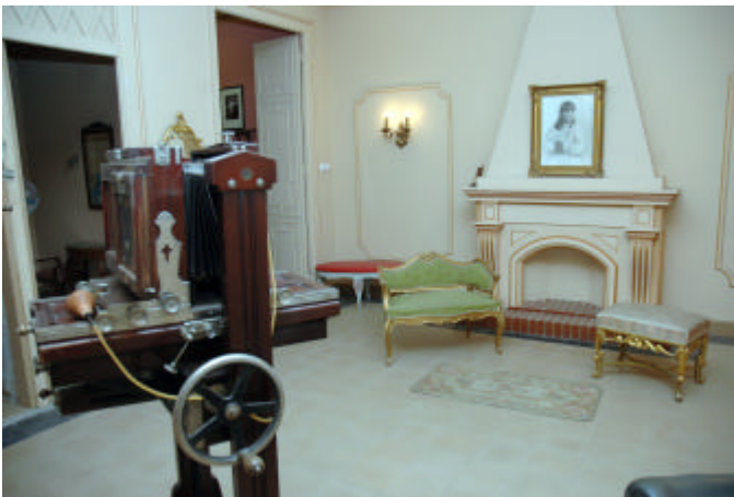
L'estudi fotogràfic actualment; a l'esquerra es veu la càmera MAMPEL.

El considerable volum del llegat va fer que el procés d'inventari i catalogació es perllongués fins a les darreries de l'any 1998, quan es va obrir al públic l'espai de l'estudi fotogràfic i es van posar a l'abast dels investigadors els conjunts d'imatges (5). A començament del 2002 es van començar les obres de rehabilitació de l'edifici, fet que va obligar a tancar el llegat al públic aquell any; el fet que les esmentades obres no hagin acabat a hores d'ara fa que el llegat estigui tancat al públic, encara que es manté la possibilitat de visitar-lo en grups reduïts amb cita prèvia.