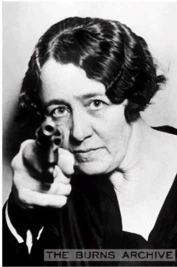
Illinois first woman sheriff takes aim, 1920.