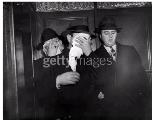
Shame Of Arrest, 24 25th January 1945