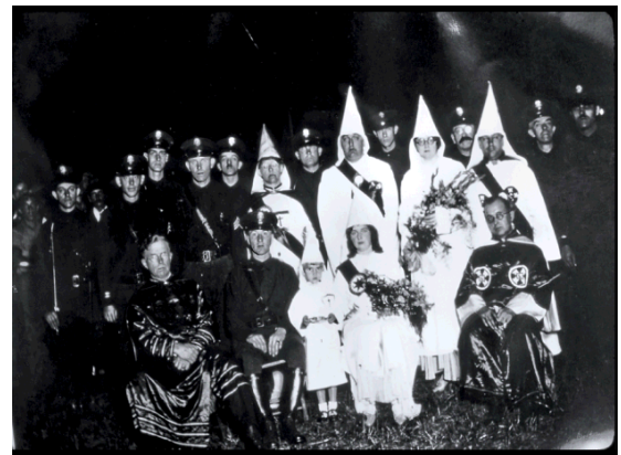
State Police with the Ku Klux Kan, 1928.

Quan el vam contactar demanant-li fotografies relacionades amb el crim i la investigació policial, el Dr. Burns ens va permetre accedir a una secció del seu web Crime and Punishment-Police Action , i així vam poder veure fotografies que no estan accessibles al públic general.