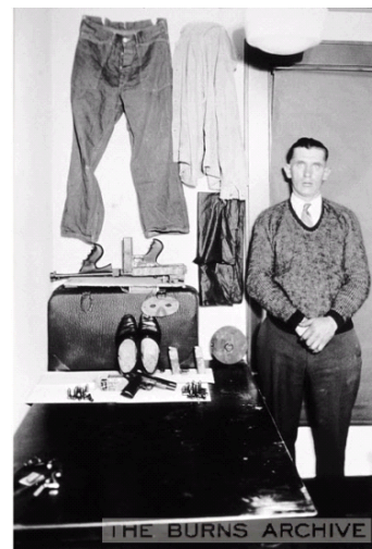
A thief poses with his equipment, 1931.

Pel què fa als arxius internacionals, un descobriment particularment interessant va ser el Burns Archive de Nova York. L'havíem descobert i utilitzat quan buscàvem fotografies post-mortem del XIX per el capítol de fotografia familiar . És una col·lecció privada de fotografia creada per un oftalmòleg que ha deixat la pràctica mèdica per dedicar-se a la de col·leccionista. Té un milió de fotografies antigues que inclouen daguerrotips, ambrotips, ferrotips i àlbums personals d'un període des de 1840 fins a l'actualitat. Animat per la seva creença que la fotografia és sovint més verídica que qualsevol text històric, el doctor va iniciar les seves