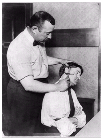
Taking Bertillon measurements. New York City Police Department.

L'any 1911-1912 comença a funcionar el Servicio de Identificación Dactiloscópica, que afegeix la fotografia a la ressenya dels detinguts (targetes alfabètiques i dactiloscòpica),