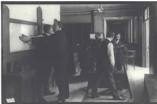
Gabinet antropomètric de l'Escola de Policia de Barcelona el dia de la inauguració del curs. Barcelona, 1911.

El primer gabinet antropomètric d'Espanya nasqué a Barcelona el 1895. Nosaltres en vam trobar un únic testimoni fotogràfic pel reportatge al fons Brangulí de l' Arxiu Nacional de Catalunya i ho vam completar amb fotografies de la col·lecció del Departament de la Policia de Nova York que es guarda a la Library of Congress .