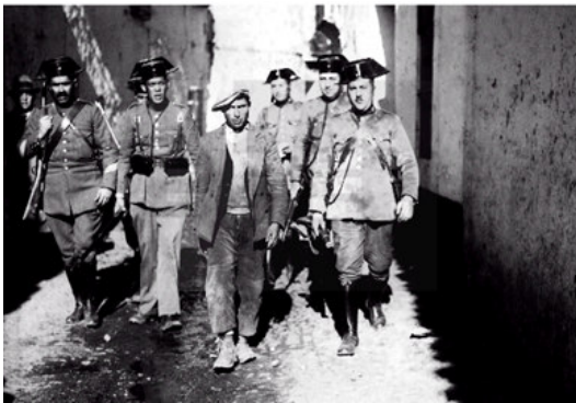
Sucesos de Castilblanco. Badajoz, 1931.

adquisicions centrat en la història de la medicina per, mica en mica, anar ampliant els centres d'interès a temes com la guerra, el crim, la mort, les malalties, la història dels jueus, l'esclavisme, el racisme. Algunes de les fotos que es poden veure al seu web també les podem trobar en llibres publicats per ell mateix.