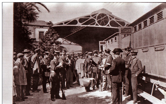
Conducció de presos en ferrocarril. Servicio de Estudios Históricos. Guardia Civil

Una primera fase de la recerca és la prospecció de possibles fonts sobre el tema que permetin la immersió, la possibilitat de documentar-se i també, obrir possibles vies d'investigació. Nosaltres vam començar fent un primer sondeig al Servicio de Estudios Históricos de la Guardia Civil. A la llum de la resposta que vam obtenir sembla que no ha quedat constància fotogràfica de l'activitat de la Guàrdia Civil dintre de la Institució. Ens van enviar quatre fotos sense datar.