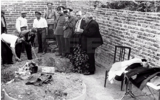
Crimen de la encajera. Madrid, 1932.

històrics de caire polític i social, com per exemple, la repressió policial d'uns vaguistes.