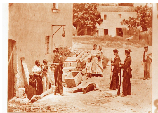
Formando una sumaria. Servicio de Estudios Históricos. Guardia Civil