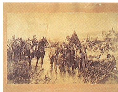
La retirada, grabado de Audouart, c. 1887. MHCG.

periodo conocido como el gran asedio de Girona. Durante siete meses terribles en que el bloqueo de las comunicaciones con el exterior —el azote del hambre y las enfermedades epidémicas apareció con toda su crudeza— y el bombardeo continuado ocasionaron un índice de mortalidad aterrador. Los últimos momentos fueron apocalípticos, sostenidos únicamente por el fanatismo del clero y la intolerancia de Álvarez de Castro que se negaba a una capitulación honrosa en un momento en que la defensa a ultranza se convertía en un sacrificio inútil. Enfermado Álvarez,