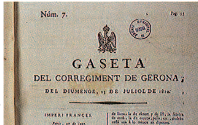
Portada de la gaceta del corregimiento de Gerona de 1810.

De entre las acciones emprendidas por los franceses para atraer a los gerundenses hay que destacar la llamada “ensayo catalanista”, inspirado