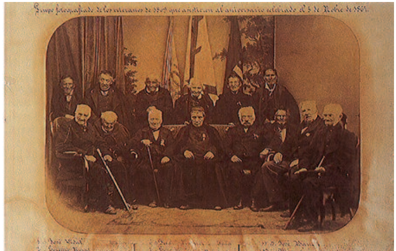
Fotografía de los veteranos de los asedios, hecha el año 1865.

Este conjunto de cambios constituyó la cara amable de la dominación francesa; la cruz se evidenció en los abusos de los militares en las requisas y en los alojamientos, y en su trato desconsiderado hacia los gobernantes civiles. Como trasfondo, y a pesar de la existencia de algunos afrancesados, más bien por interés material que no por convicción ideológica, la mayoría de los gerundenses percibieron la dominación francesa como una ocupación militar y se limitaron a esperar que la guerra diese un giro definitivo a