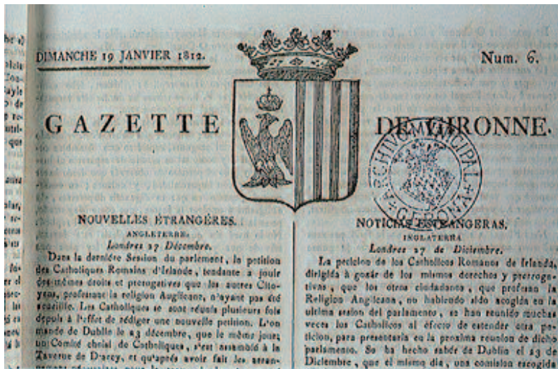
Portada de la Gazette de Gironne del año 1812.

Acabados los asedios, la visión que presentaba la ciudad era, sin duda, sorprendente: los cerca de 8.000 habitantes de 1808 no llegaban ahora a los 5.000, y una estadística municipal señalaba que había 242 casas absolutamente derruidas, 48 casas parcialmente derruidas y 104 casas