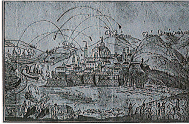
Girona durante el ataque del ejército francés, desde Monjuic.

Así, los franceses llegaron a Girona por primera vez el 10 de febrero de 1808, y, al conceptuar de irrelevantes y faltas de valor estratégico a las antiguas fortificaciones de la ciudad, decidieron continuar hacia Barcel-