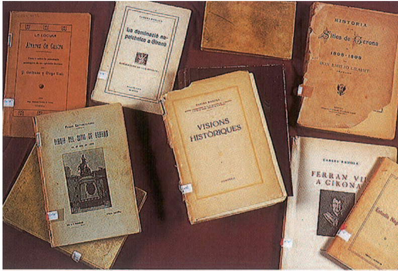
Libros sobre el episodio de los asedios de Girona, sus protagonistas y sobre la dominación napoleónica. AHCG.