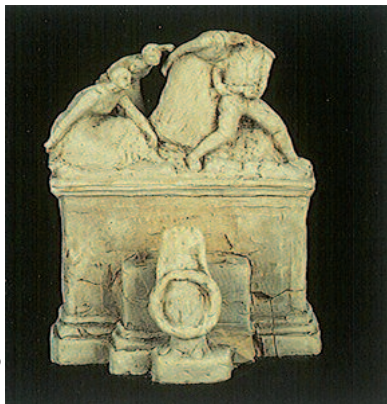
Proyecto no realizado para el monumento de las heroínas de Santa Bárbara, de Fidel Aguilar; c.1915. MHCG.