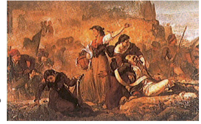
Las Heroínas de Santa Bárbara de Ramón Martí y Alsina, c. 1860. Museo de Arte de Girona.

mando del general Duhesme. Se trató de lo que ha sido llamado tradicionalmente el primer asedio, y que significó el enfrentamiento de 11.000 soldados franceses con la población civil de Girona que fue reforzada con 2.500 soldados enviados por la Junta Superior de Cataluña.