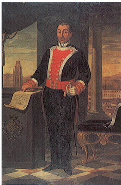
Retrato de Álvarez de Castro de Eduard Greuzner. 1860. MHCG

periodo conocido como el gran asedio de Girona. Durante siete meses terribles en que el bloqueo de las comunicaciones con el exterior —el azote del hambre y las enfermedades epidémicas apareció con toda su crudeza— y el bombardeo continuado ocasionaron un índice de mortalidad aterrador. Los últimos momentos fueron apocalípticos, sostenidos únicamente por el fanatismo del clero y la intolerancia de Álvarez de Castro que se negaba a una capitulación honrosa en un momento en que la defensa a ultranza se convertía en un sacrificio inútil. Enfermado Álvarez,