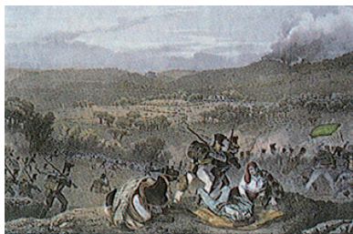
Prise du grand convoy de Gerona, le 26 d'avril de 1809. Grabado. AHCG.