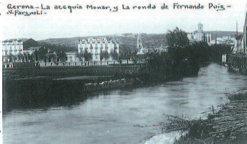
La acequia Monar. La acequia Monar, derivación de agua del Ter que desemboca en el Onyar, tuvo un papel relevante en el inicio de la industria moderna. Se beneficiaron las fábricas textiles de Salt y Santa Eugènia y el núcleo de empresas que se instaló en el barrio del Mercadal.

escapó de la fiebre industrializadora del país. Las posibilidades derivadas de la acequia Monar, que era propiedad del Ayuntamiento desde el siglo XVII, atrajeron ya en la década de 1820 a un fabricante procedente del Esquirol llamado Joan Planas. A lo largo de tres generaciones los Planas se convirtieron en el símbolo de la industrialización de Girona. Su hito más importante fue la instalación, en 1857, de la fundición Planas.