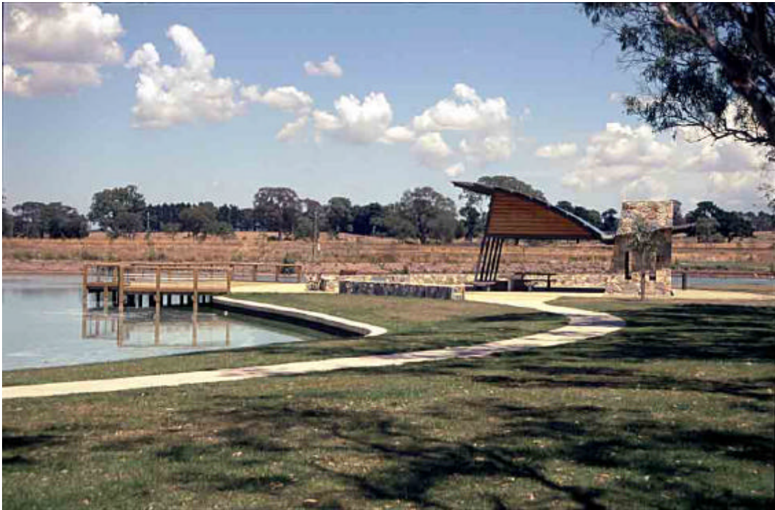
Foto 2: Bassa a Melbourne (AU). Generalment les basses de tractament d'aigües pluvials es poden integrar i compatibilitzar amb parcs públics.