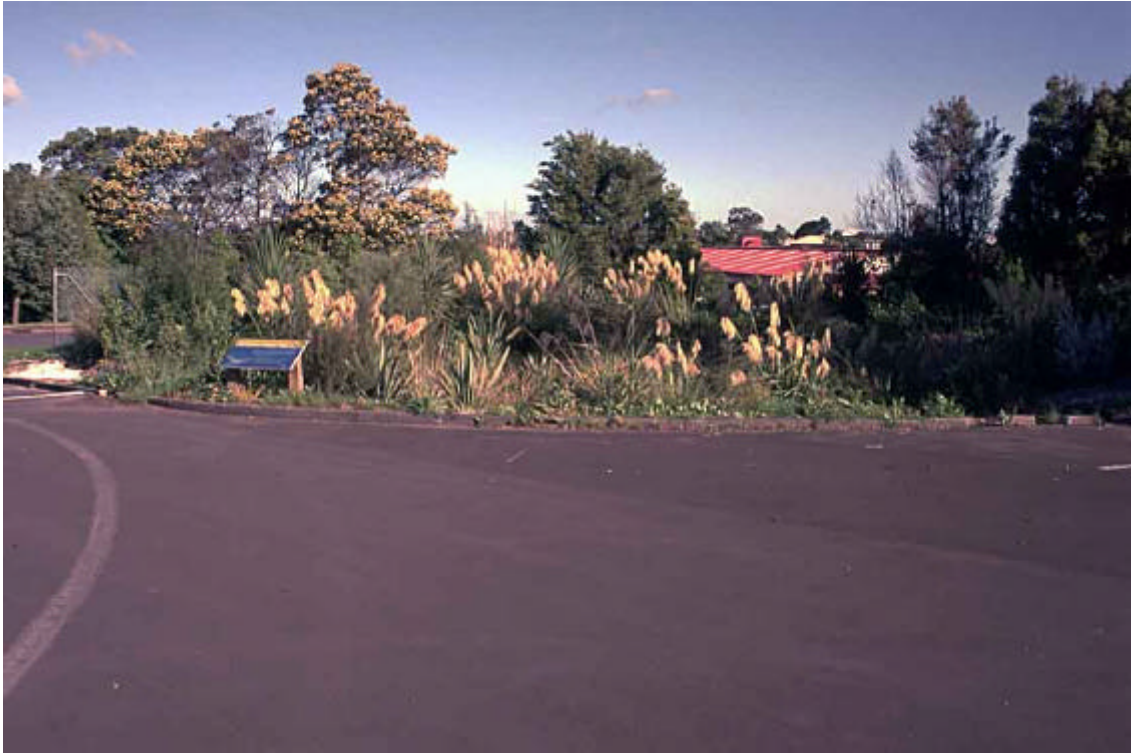
Foto 4: Aparença del sistema de filtració. A la dreta es poden observar els talls realitzats a la vorada per tal que l'escorriment superficial de l'aparcament vagi a la zona d'infiltració, on s'hi han plantat plantes autòctones que col·laboren en el tractament