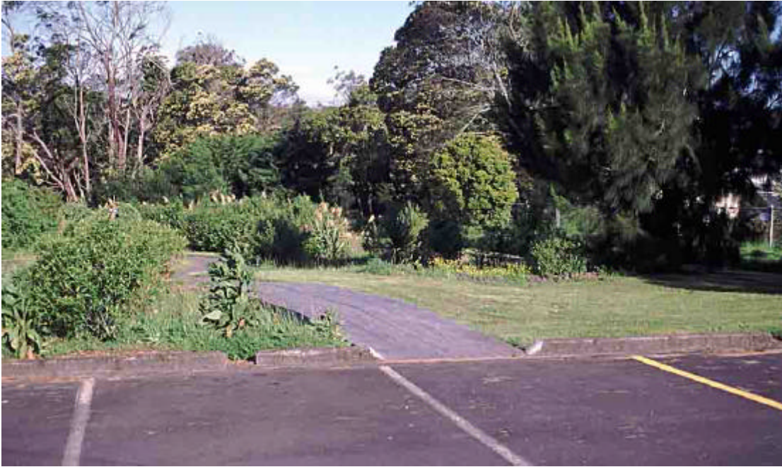
Foto 8: Tan sols fent passar les aigües pluvials per sobre de la gespa obtenim una millora significativa de la qualitat de l'aigua. A més, donem la oportunitat per què una part s'infiltri per comptes d'anar directament al riu. L'escorriment d'aquest aparcament es fa passar per la vegetació de la zona verda que hi ha al costat abans d'arribar a una bassa on es fa el gruix del tractament.