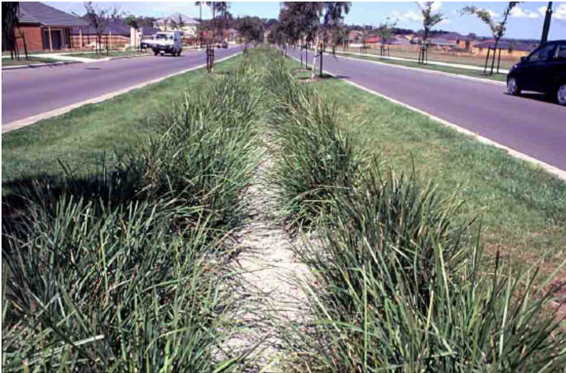
Foto 7: En aquesta urbanització de Melbourne (AU) no hi ha cap embornal per les aigües pluvials. En aquest cas, l'escorriment del carrer va a parar a aquesta mitjana i es porta a través d'aquest canal amb grava i vegetació fins a una bassa on es completa el tractament.

infiltració de part de l'aigua al terreny. Són una bona alternativa a canonades i canals sempre que la velocitat de l'aigua no hi sigui elevada.