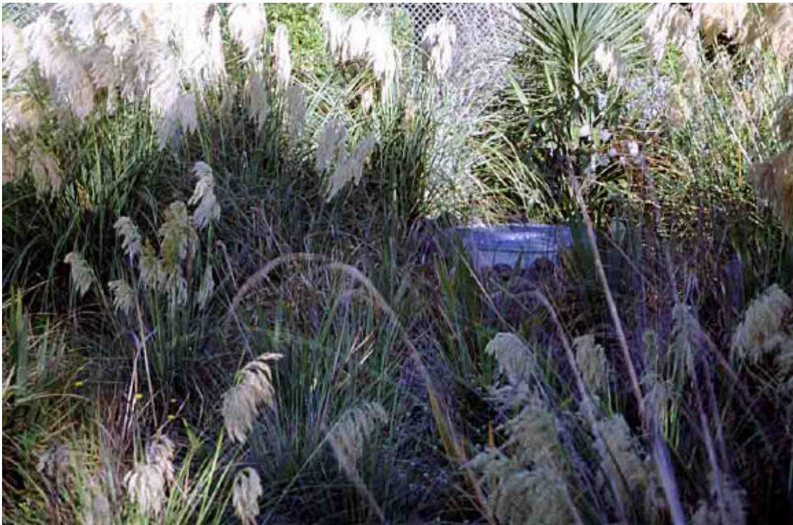
Foto 5: Sobreexidor del sistema. En cas de pluges molt importants, les aigües s'evacuen per aquest sobreexidor.