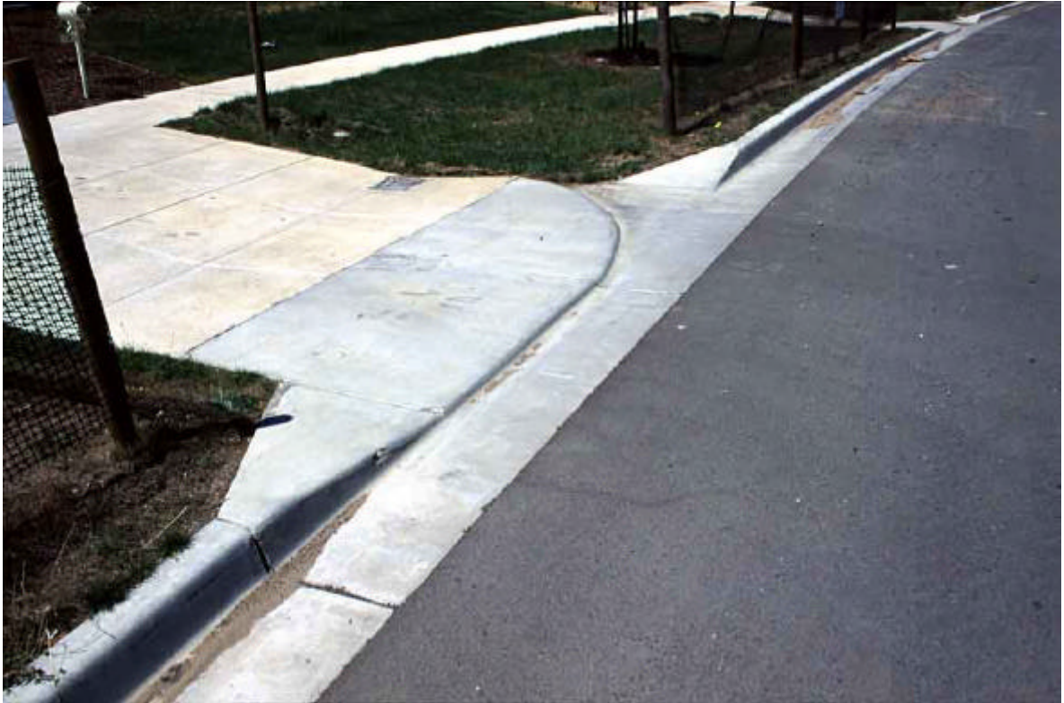
Foto 6: Melbourne (AU). L'escorriment del carrer es dirigeix a una zona d'infiltració on s'ha tingut especial cura de no compactar el terreny amb el pas de maquinària per sobre. En les zones d'infiltració, el terreny està compostat per sorres per tal que tingui un bon coeficient de permeabilitat.

Un altre sistema d'infiltració consisteix en què en els pous de registres de la xarxa de pluvials, la solera del pou no existeix i en el seu lloc hi hagi graves, de manera que es permet la infiltració al terreny de les aigües pluvials.