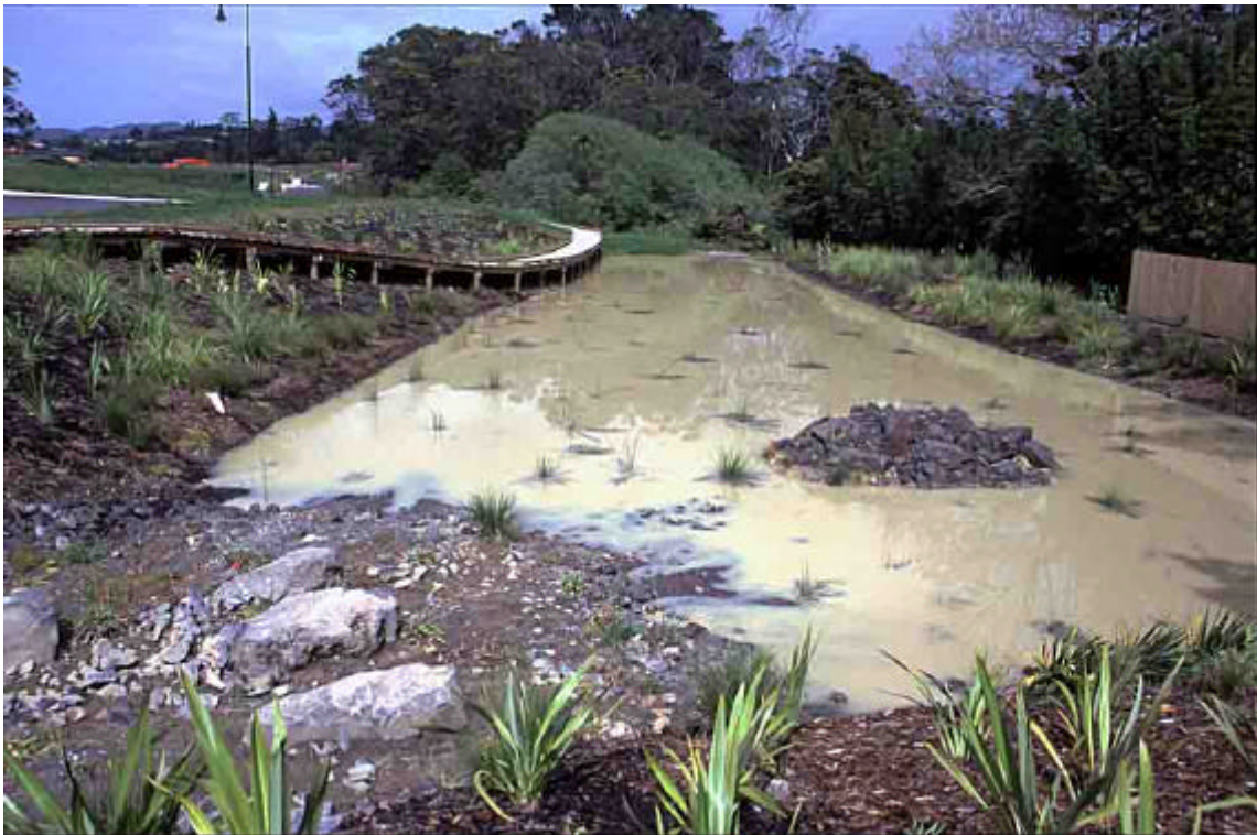
Foto 1: Bassa per al tractament d'aigües pluvials a Waitakere (NZ). Al promotor d'una urbanització se'l va obligar a construir aquesta bassa per a tractar les aigües pluvials i compensar l'augment del coeficient d'escorriment causat per la urbanització. En el moment de fer la foto, s'estava construint la urbanització i per això hi ha tants de sòlids en suspensió a l'aigua. Amb aquest tipus de basses es pot eliminar fins al 75% dels sòlids en suspensió.

Basses: es dissenyen de manera que l'aigua en entrar passi primer per una zona de sedimentació de sòlids en suspensió i surti de la bassa per una zona poc profunda on hi hagi macròfits per tal de reduir nutrients. També existeixen combinacions de basses amb basses de retenció.