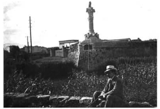
Vista de les muralles del Mercadal