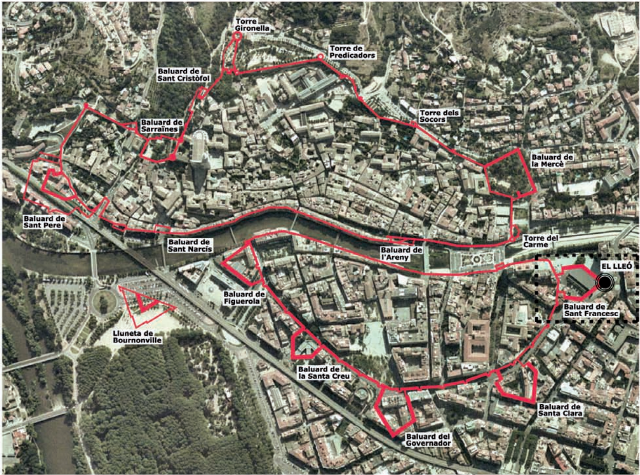
Situació de les muralles de Girona