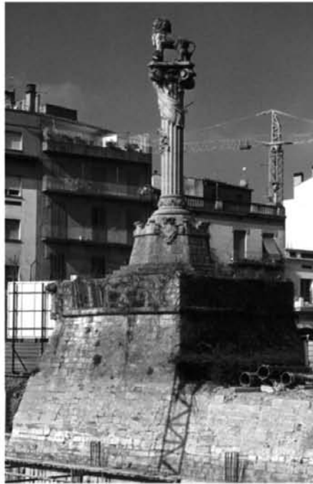
Obres de construcció del Pàrquing a la Plaça Calvet i Rubalcaba