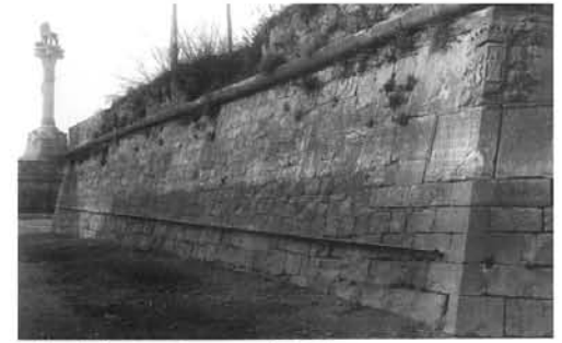
Baluard de Sant Francesc (1654)