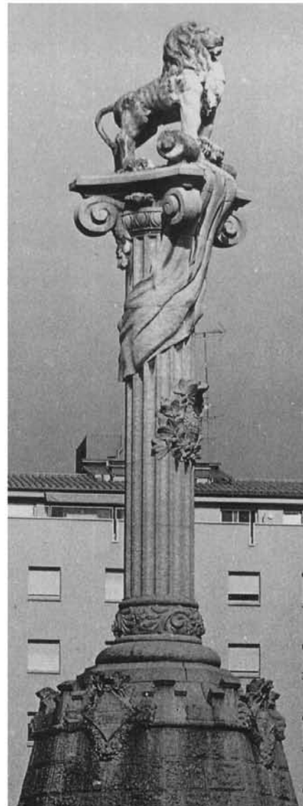
Columna i Lleó definitius (Any 1915)