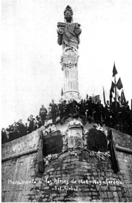
El Monument del Lleó inagurat el 7 de novembre de 1909